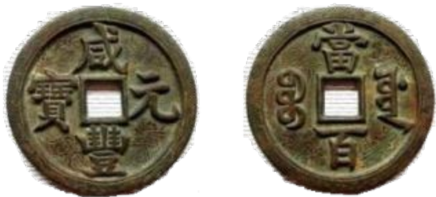
Серебряные кольца – в Египте