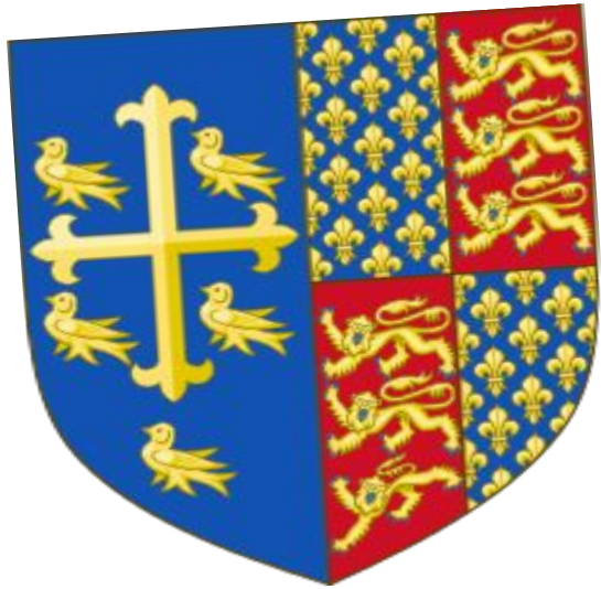
герб короля Англии Ричарда II