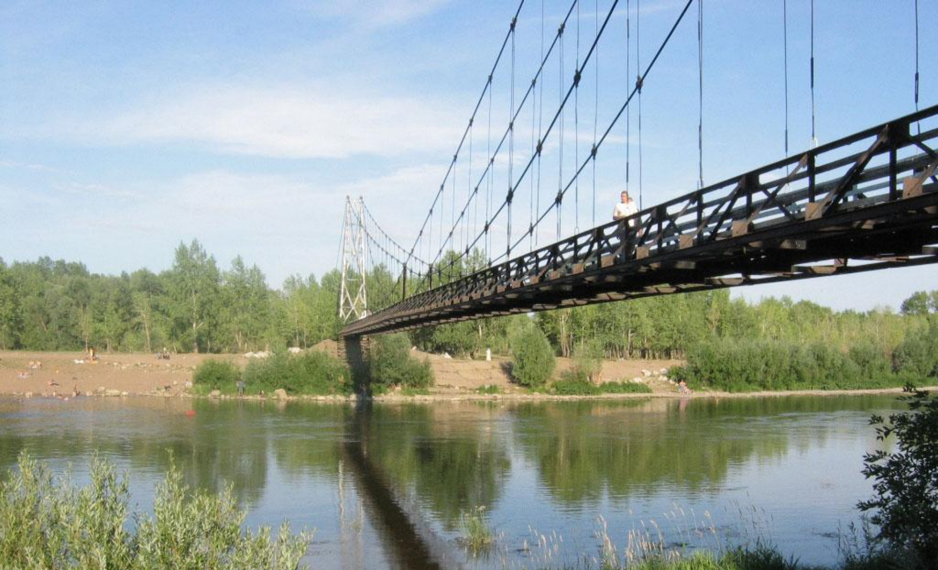
Мост через реку Белая