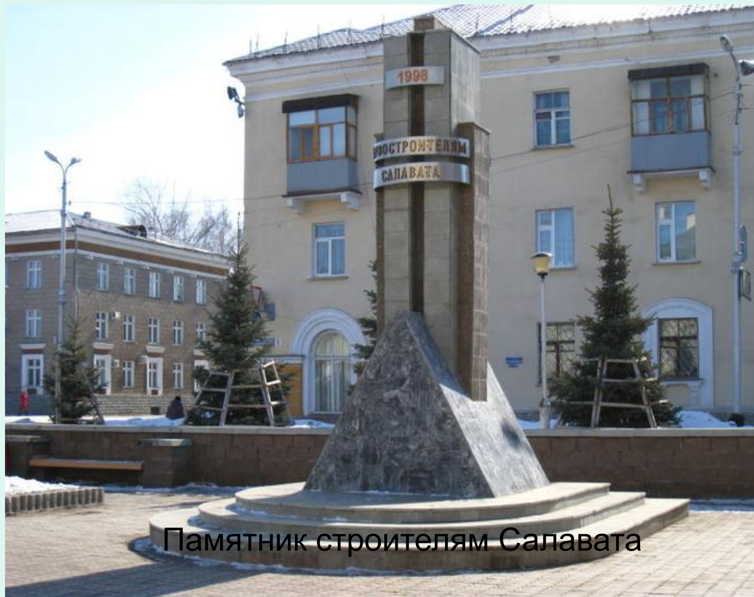
Памятник строителям Салавата