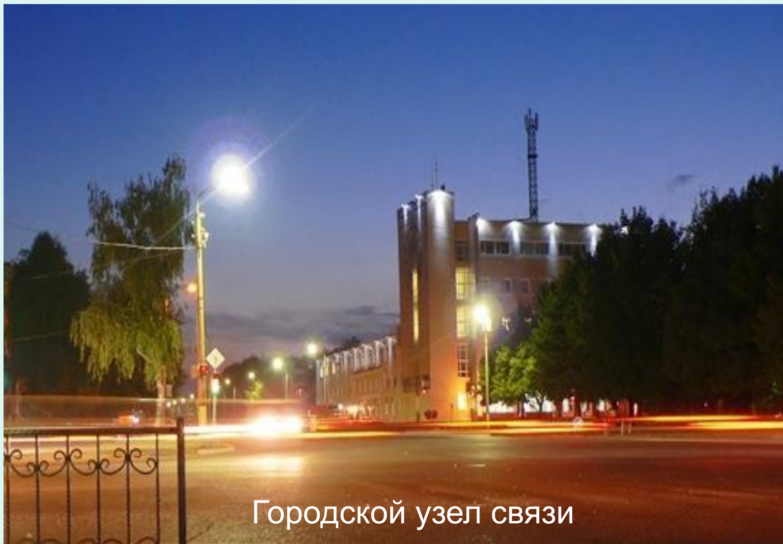
Городской узел связи