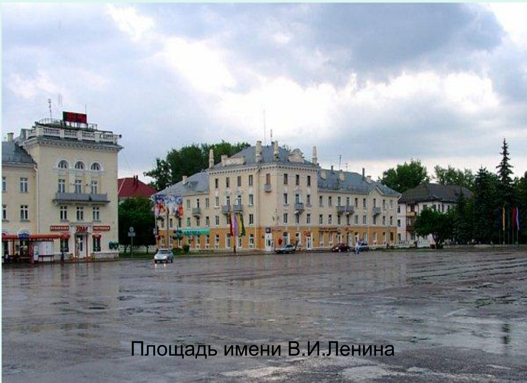
Площадь имени В.И.Ленина