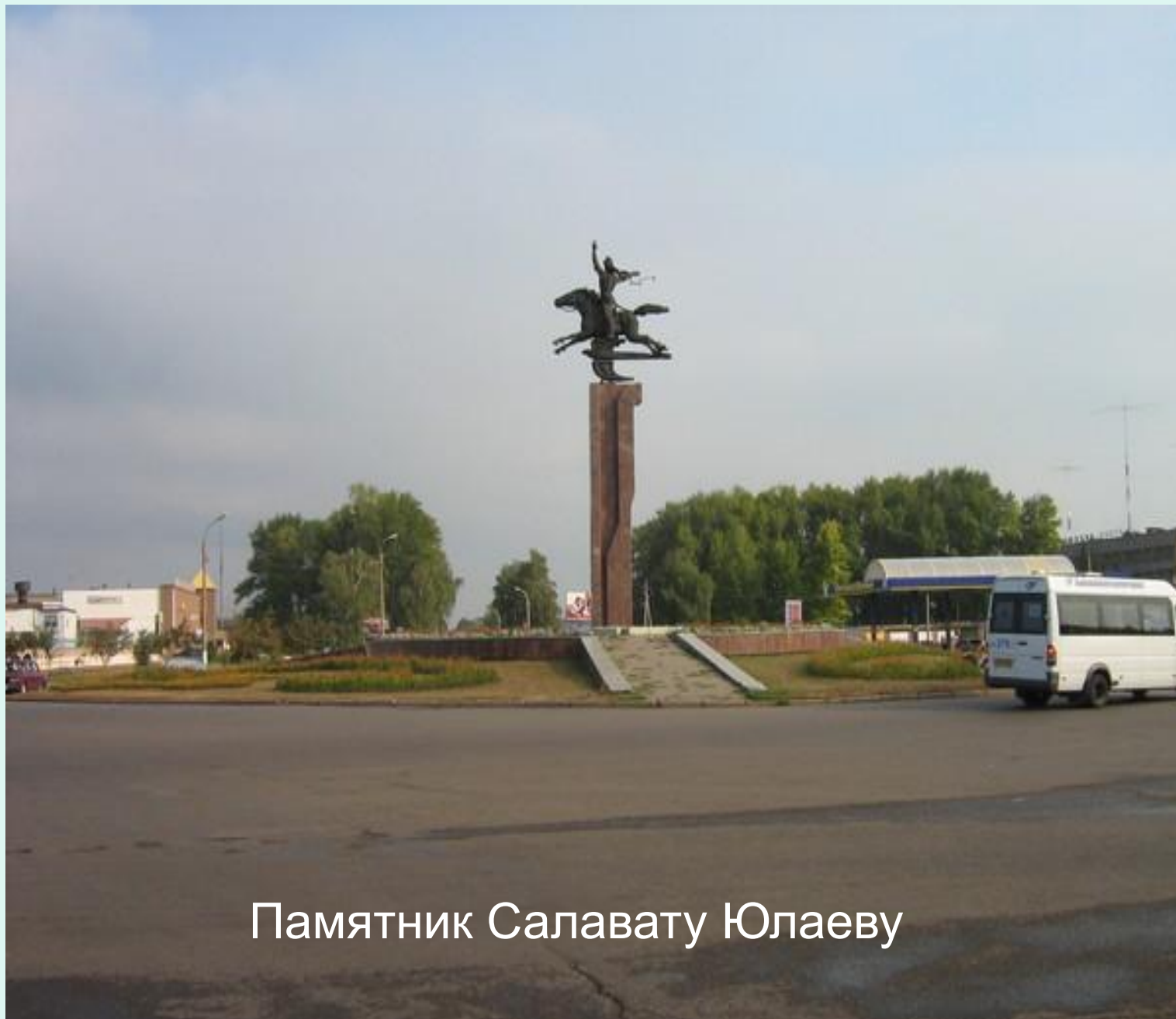
Памятник Салавату Юлаеву