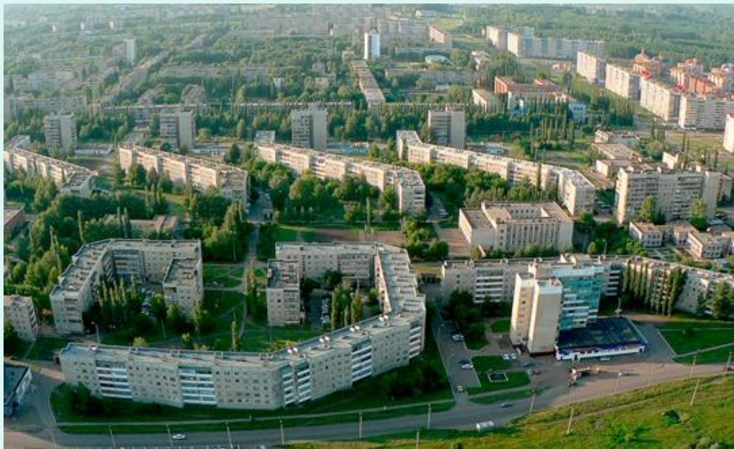
Вид города Салавата