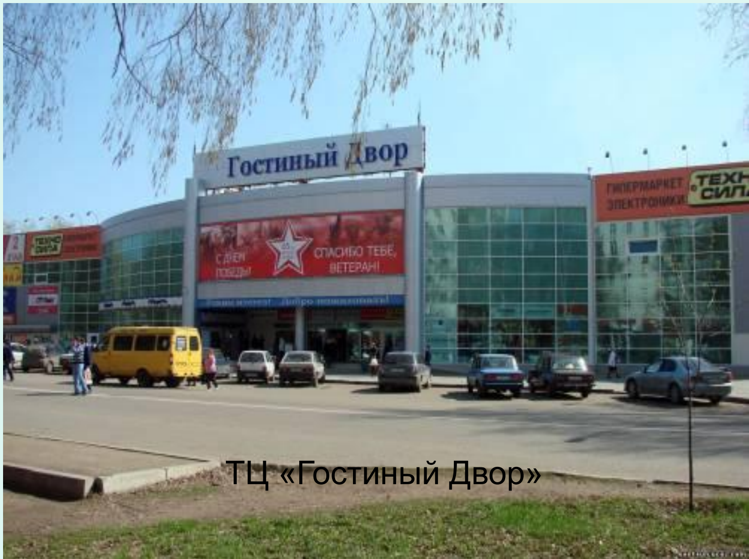
ТЦ «Гостиный Двор»