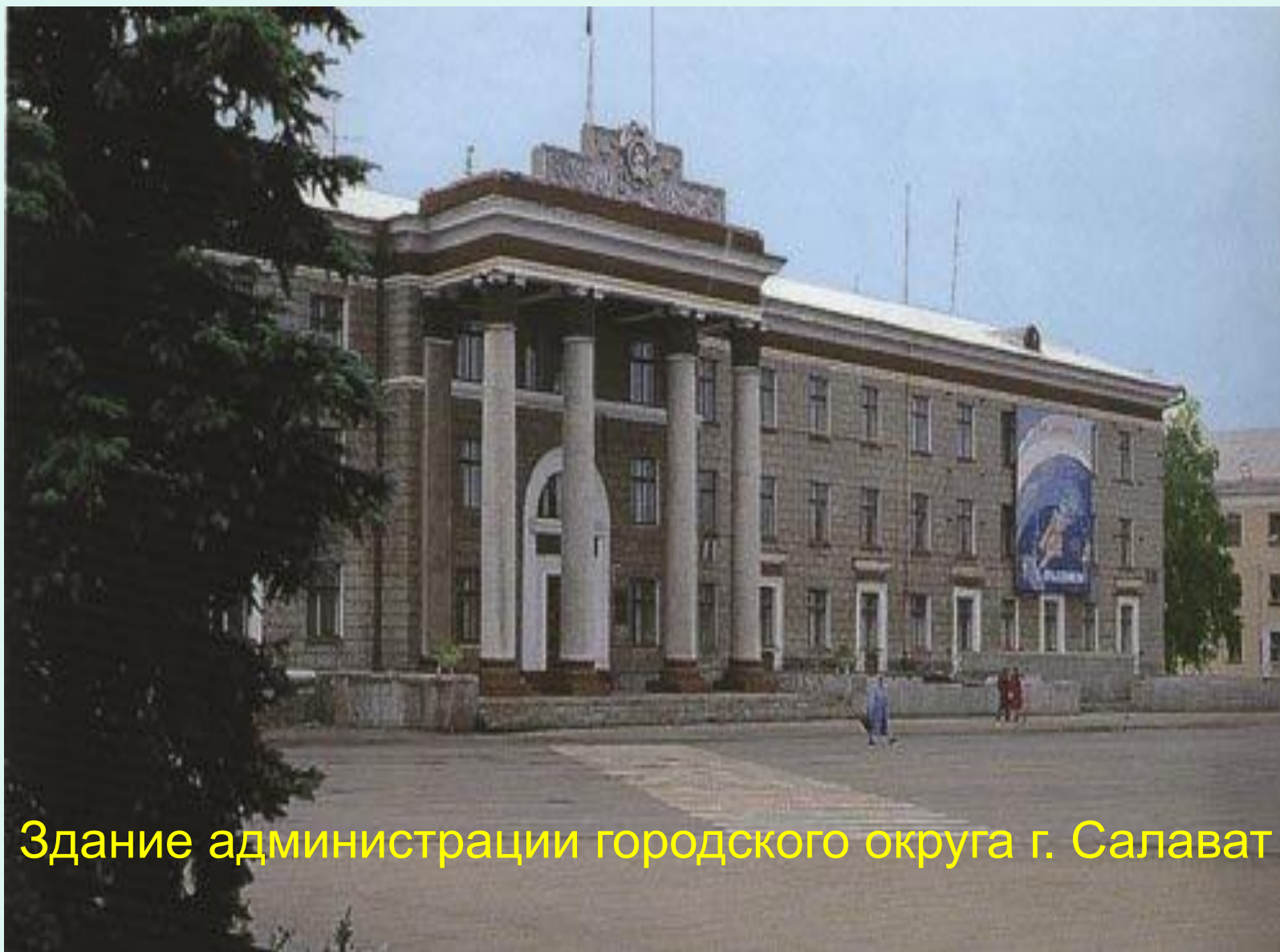
Здание администрации городского округа г. Салават