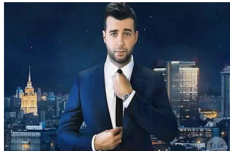
Иван Ургант актёр, телеведущий