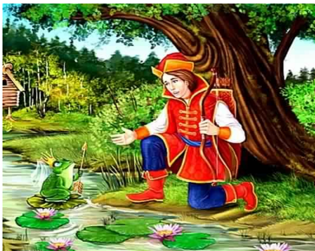
Иван - герой русских народных сказок