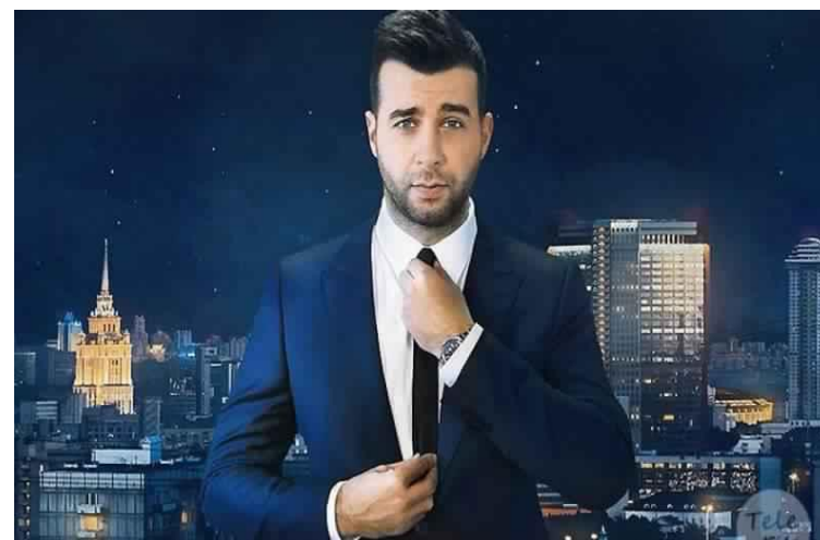
Иван Ургант актёр, телеведущий