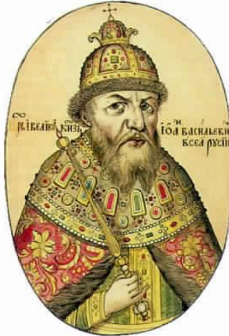
Иван Грозный русский царь