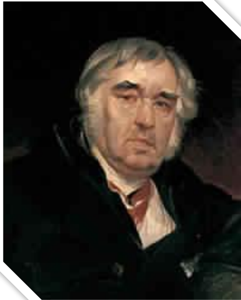
Иван Крылов русский баснописец