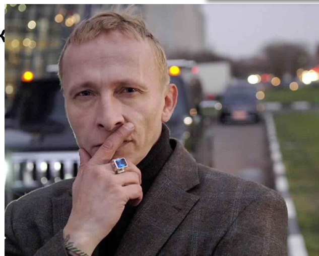
Иван Охлобыстин актёр, режиссёр