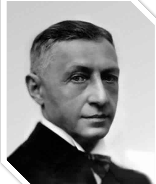
Иван Бунин русский писатель