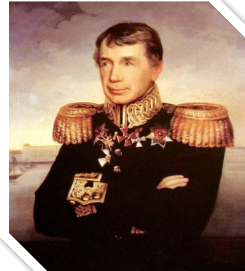
Иван Крузенштерн (1770-1864) — русский мореплавател, начальник первой российской кругосветной экспедиции, адмирал, один из основоположников отечественной океанологии.