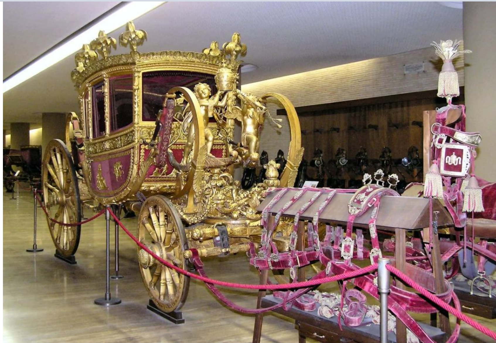
Исторический музей Ватикана