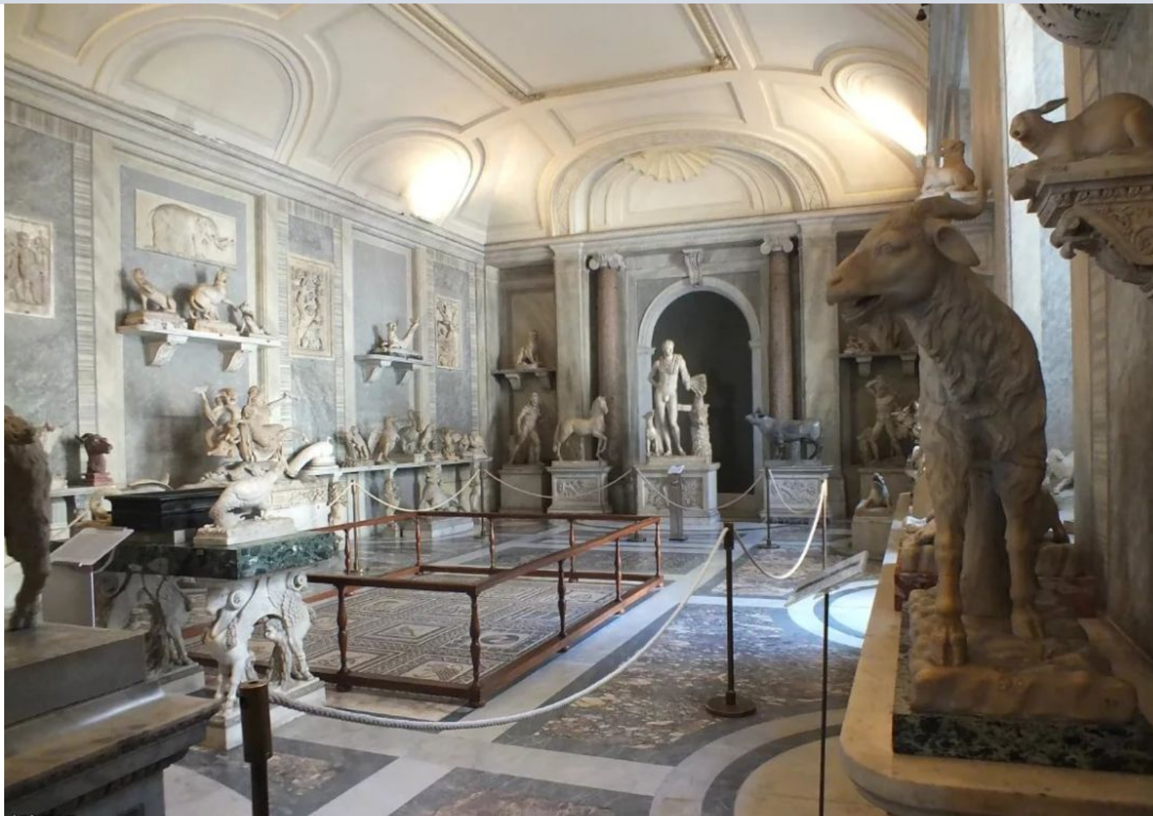
Исторический музей Ватикана