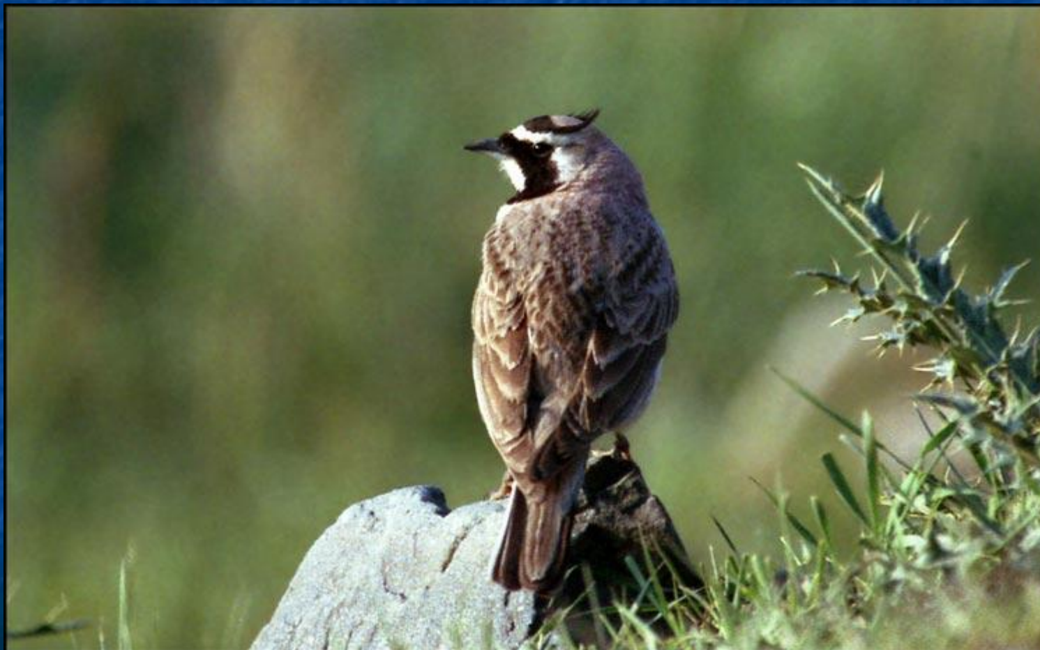
Жаворонок рогатый ( Eremophila alpestris )

Респ. Кыргызстан, Нарынская обл., Кочкорский р-н, Внутренний Тянь-Шань, долина р. Кыз-Арт, 1.07.2003