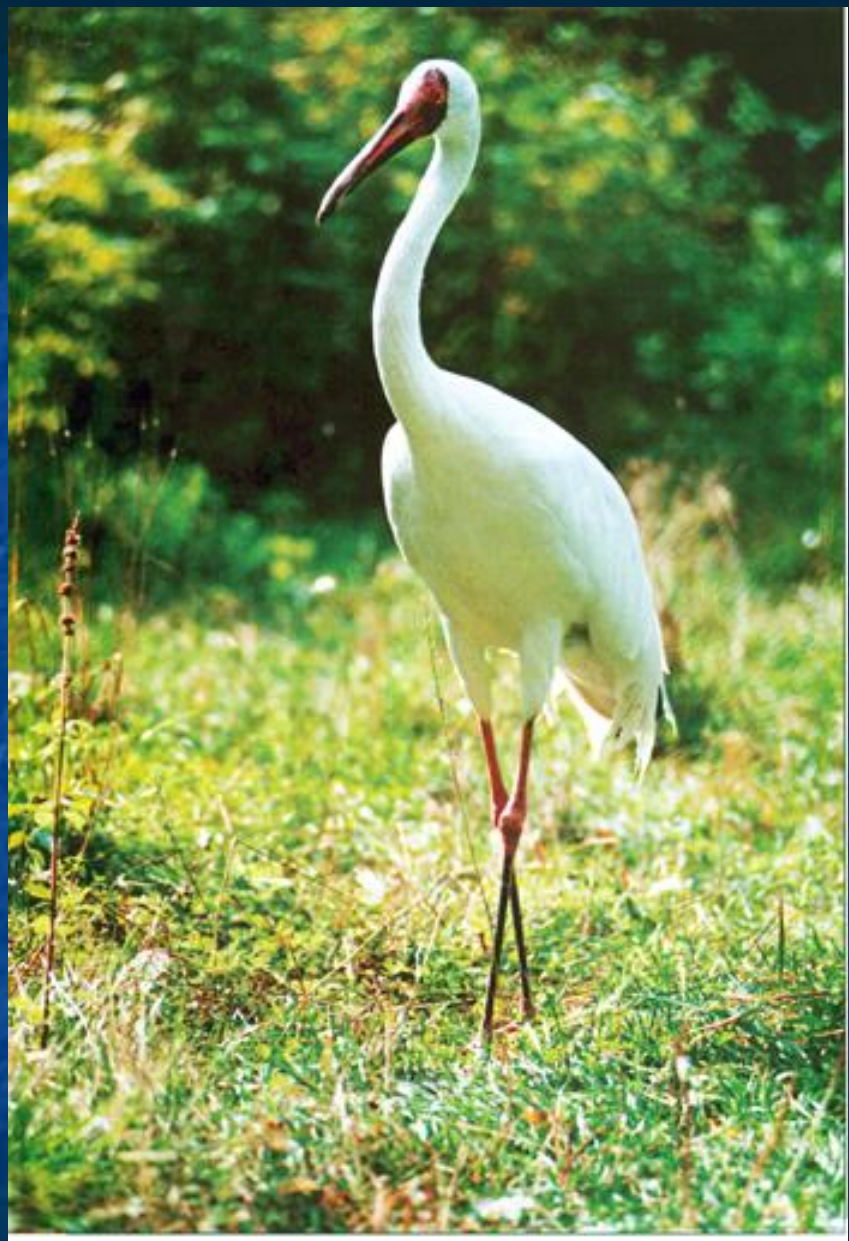
стерх, белый журавль