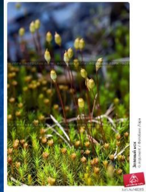
Зелёный мох Флора Санкт-Петербурга