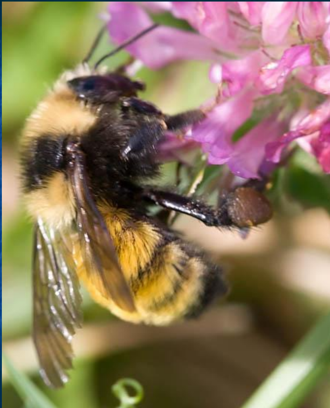
северный золотой шмель