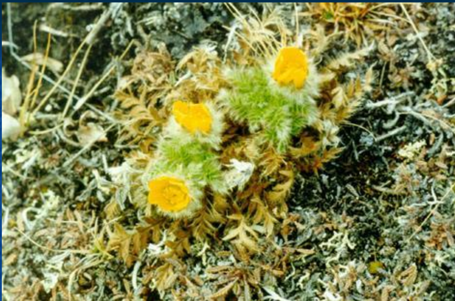
новосиверсия ледяная, арктическая роза