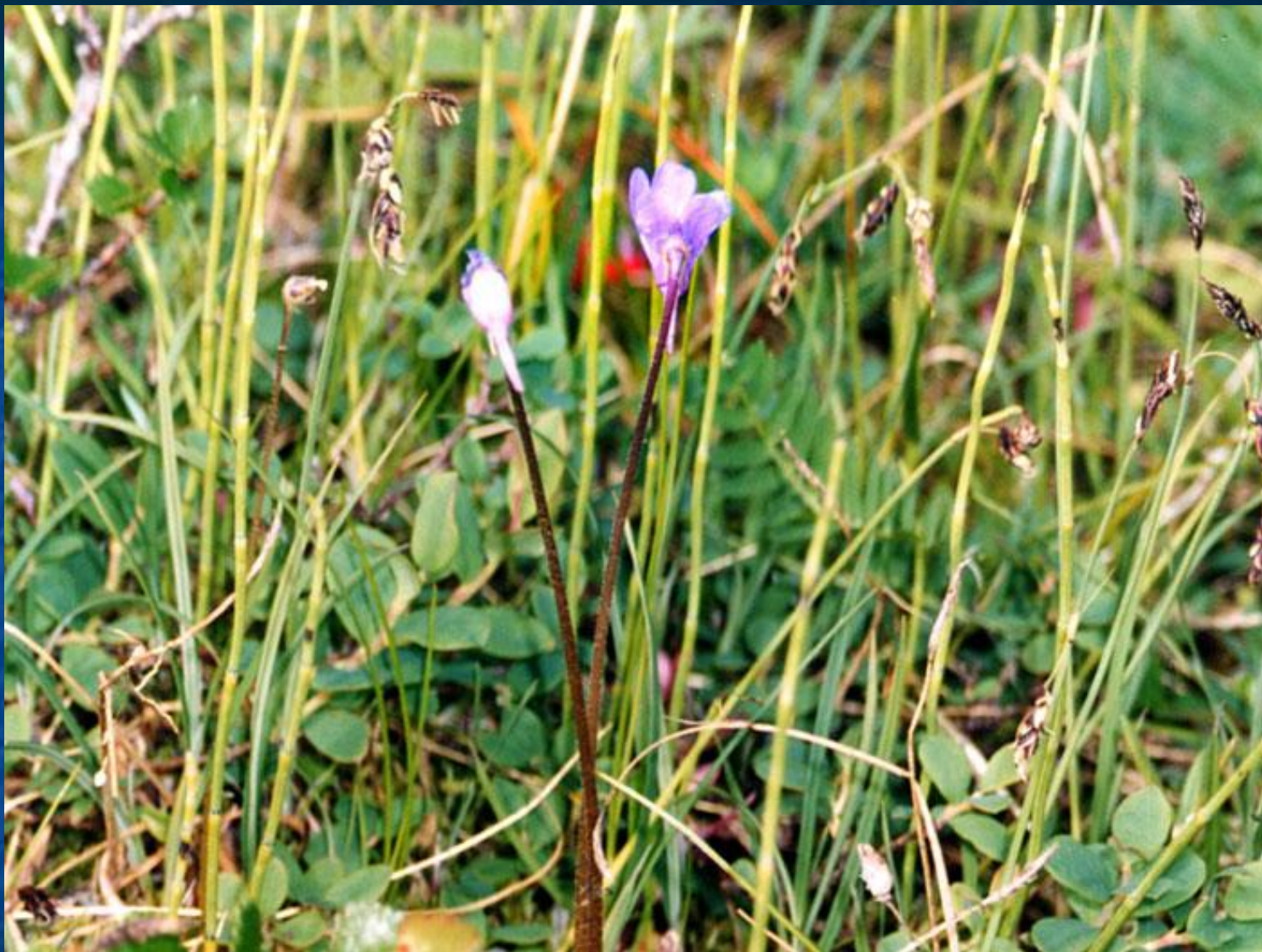
Насекомоядное растение в тундре — жирянка обыкновенная