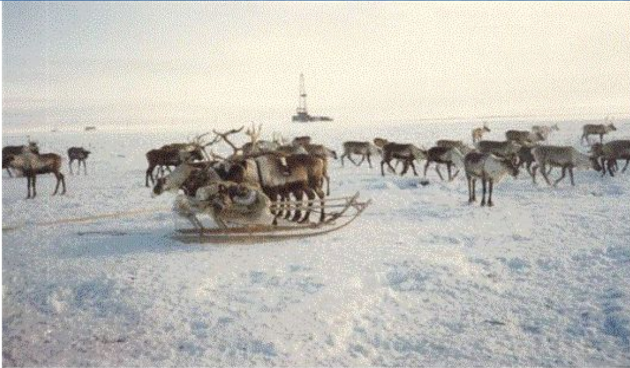
Рис. 14. Стадо оленей находкинских ненцев возле газопромысла

Идёт оленье стадо по тундре, пасётся и вдруг – препятствие. Дорогу стаду перегородили большие газовые трубы. Что же делать? Что придумать людям, чтобы не мешали трубы кочующим оленьим стадам?