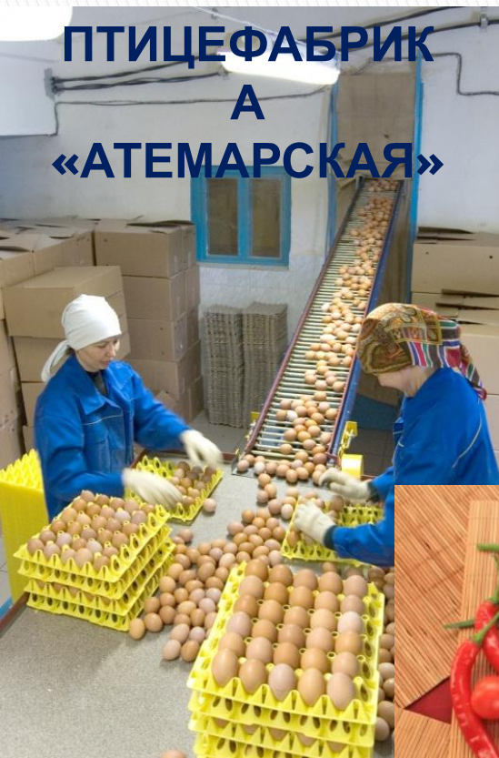
ПТИЦЕФАБРИК А «АТЕМАРСКАЯ»