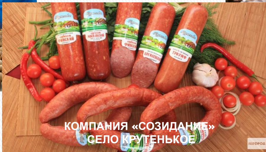
КОМПАНИЯ «СОЗИДАНИЕ» СЕЛО КРУТЕНЬКОЕ

По производству яиц, молока, свинины и мяса крупного рогатого скота на душу населения регион находится на первом месте в России