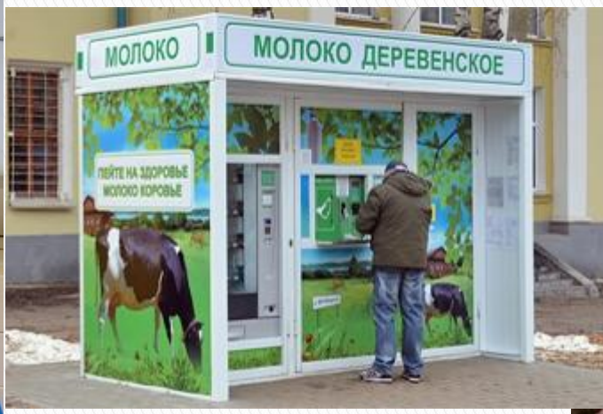
ЗАО "Мордовский бекон - КОВЫЛКИНО"