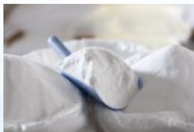
Соль поваренная пищевая