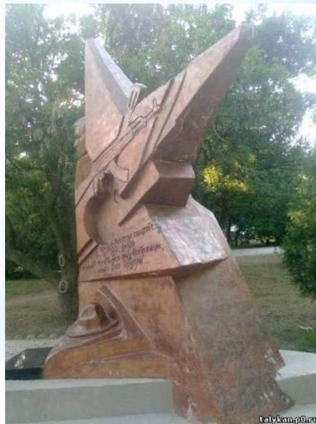
Памятник воинам афганцам