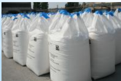
Сода кальцинированная техническая