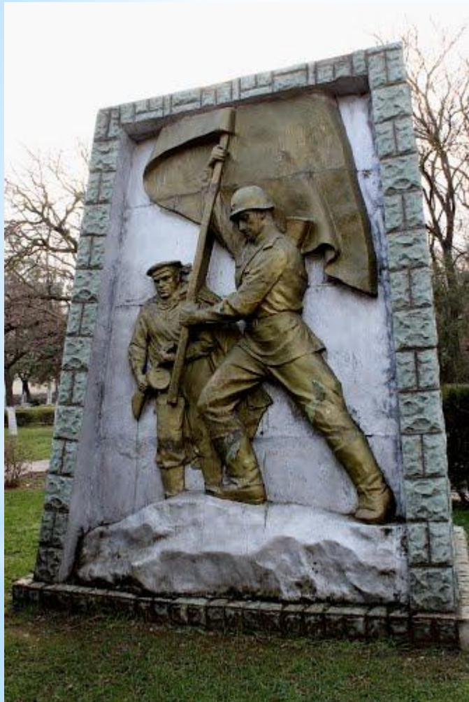
Памятник героям Перекопа