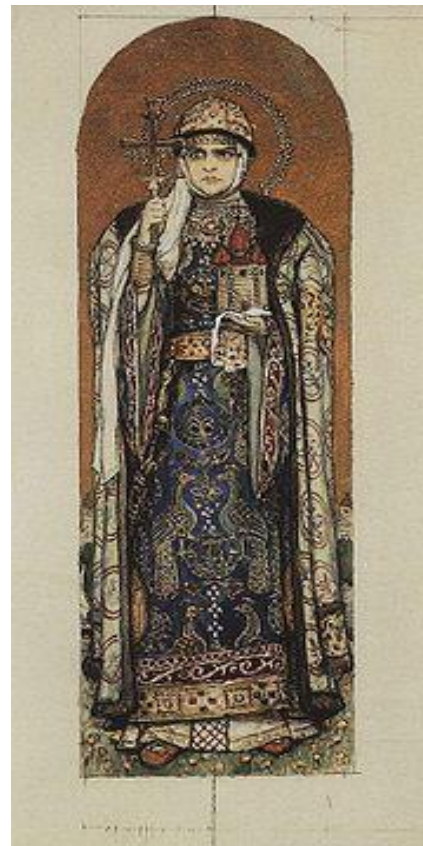
Княгиня Ольга. В. М. Васнецов

Только самые яркие личности остаются в памяти народной, только о них повестьуют летописи. Но и среди летописных рассказов выделяется история жизни и деяний княгини Ольги.