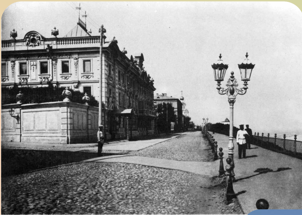
Особняк Рукавишников на Верхне-Волжской набережной. Конец 1890-х гг.

Коллекция музея меняла место своего размещения. Это было здание Дворянского собрания на ул. Б. Покровской, особняк купца С. М. Рукавишникова.