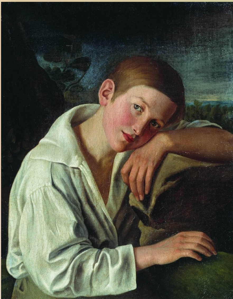
Пётр Ефимович Заболотский «Мальчик в белой рубашке»(1828)