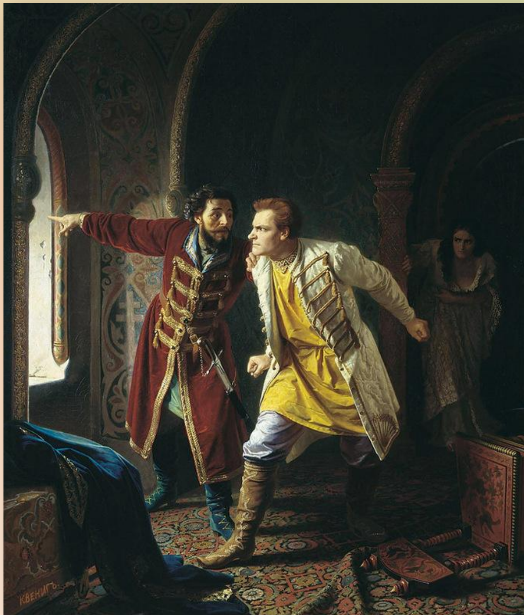
К. Б. Вениг «Последние минуты Дмитрия Самозванца»