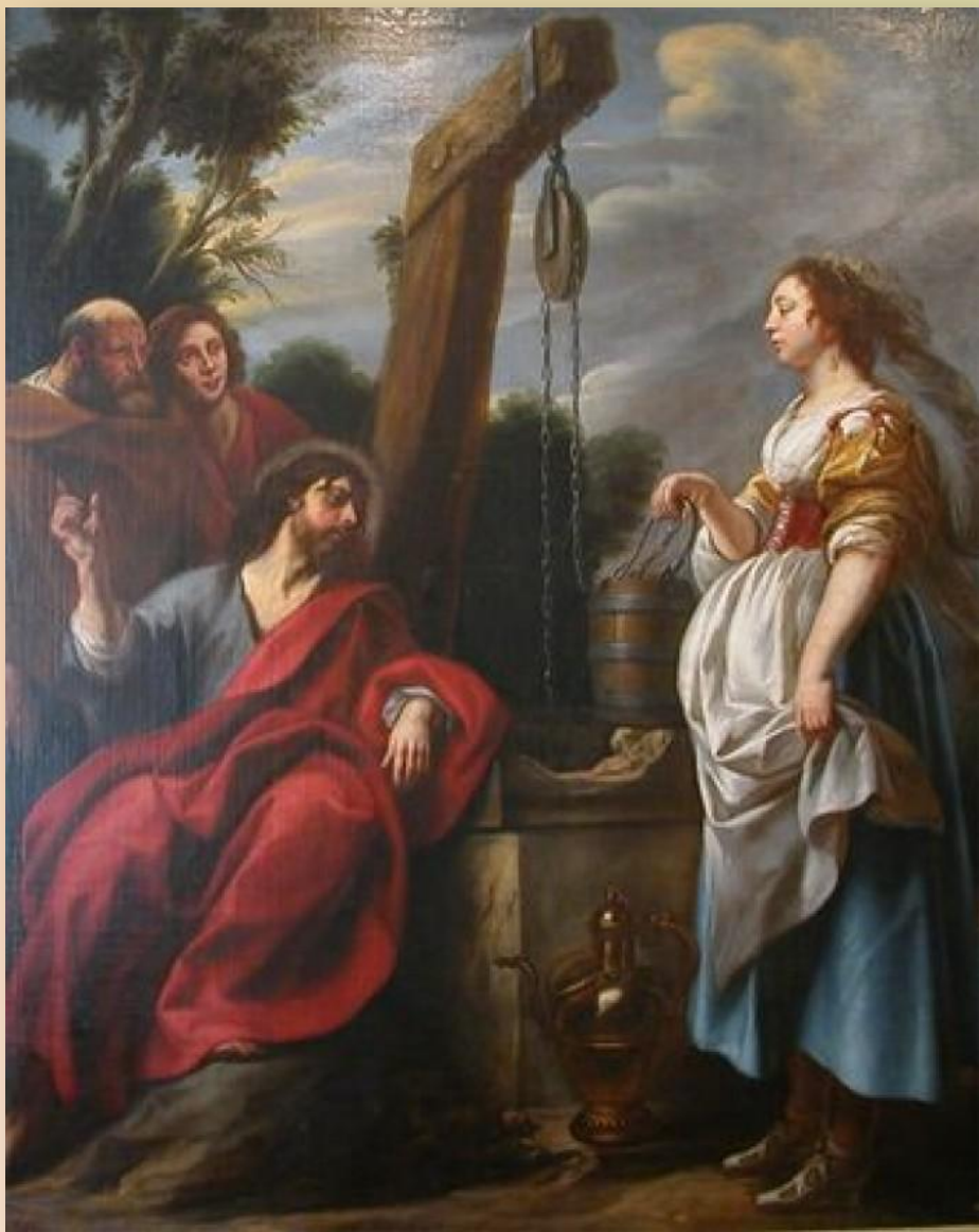
Якоб Йорданс «Христос и самаритянка»