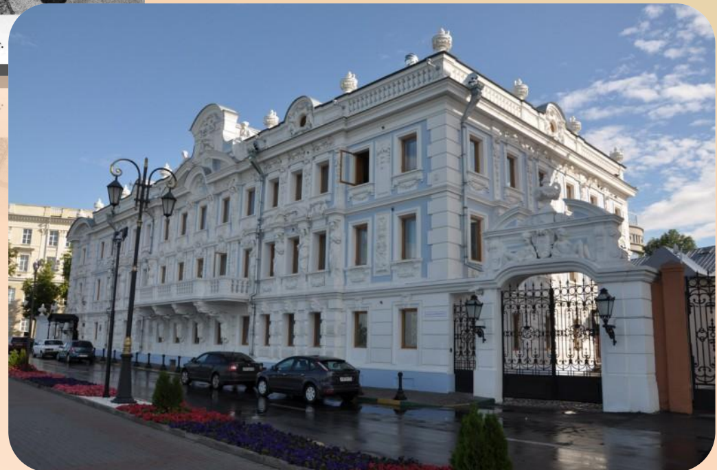
Особняк Рукавишников на Верхне-Волжской набережной. Конец 1890-х гг.

агдлп/саш/зоре/до пв/рз/афед рл/Олеа/дид/сееа