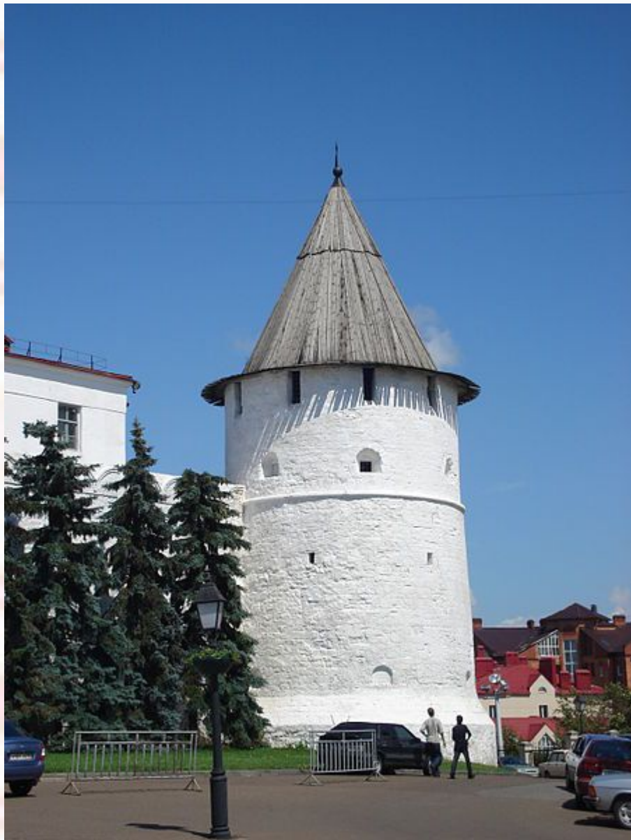
Юго-Восточная круглая башня