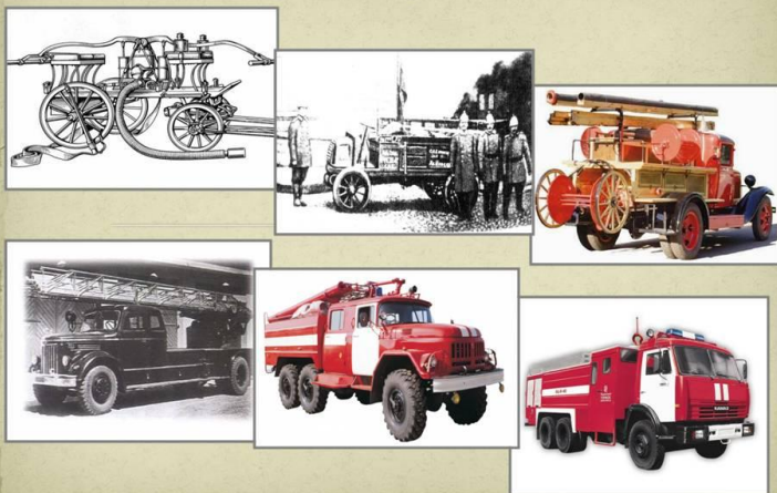
Развитие пожарной техники

В России официально была утверждена профессия пожарного в 1649 году во время правления Алексея Михайловича.