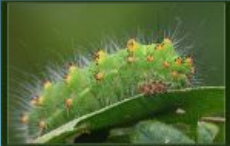
Гусеница большого ночного павлиньего глаза