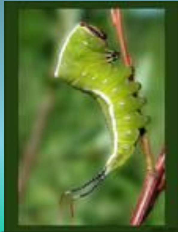
Гусеница большой гарпии