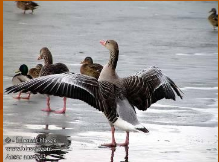
Цапли и гуси летят шеренгой