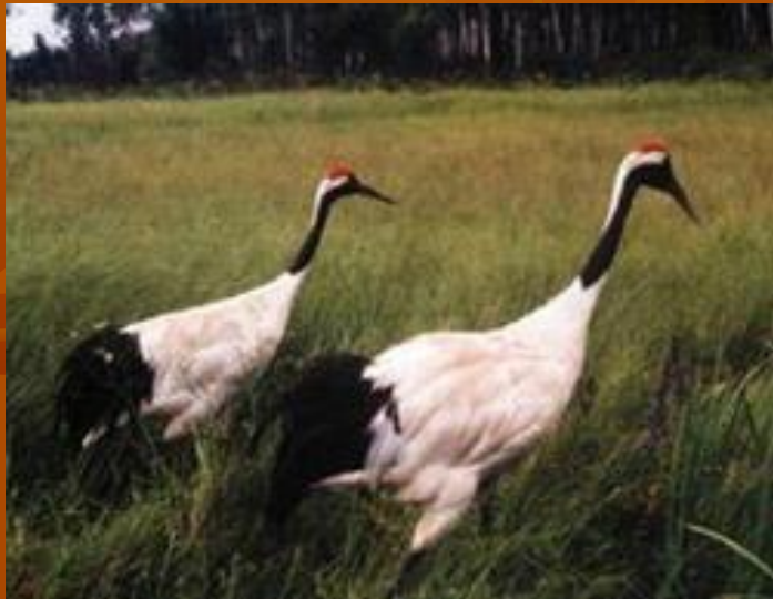
Журавли летят клином