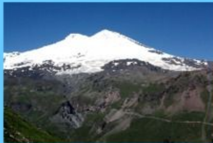
Гора Эльбрус (семь чудес России)