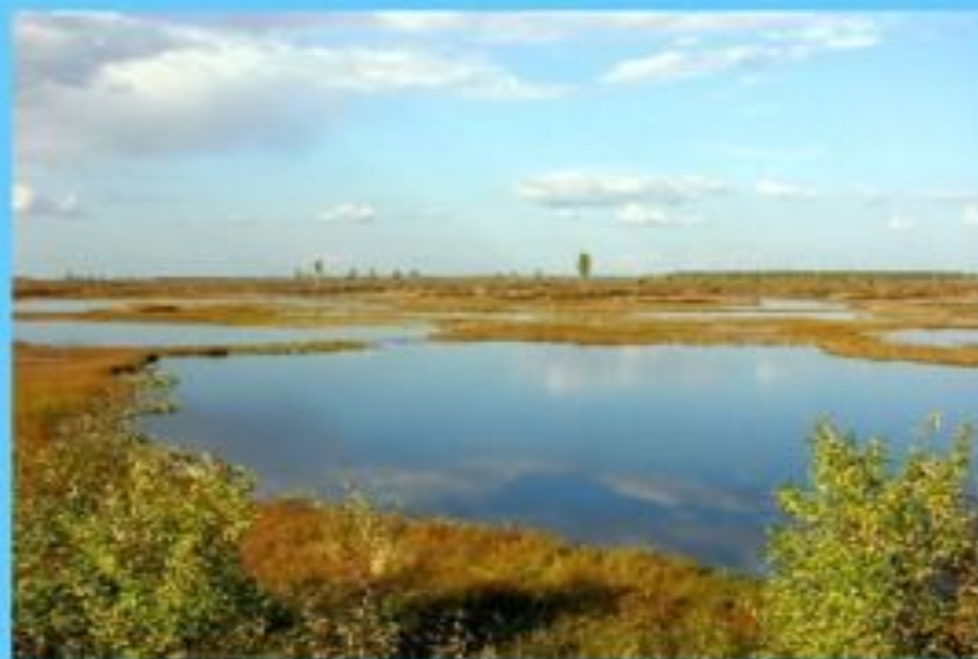
Западно-сибирская равнина, низменность.

Равнины – это ровные или почти ровные участки земли. На равнинах можно встретить возвышения – ХОЛМЫ и углубления с крутыми склонами – ОВРАГИ .