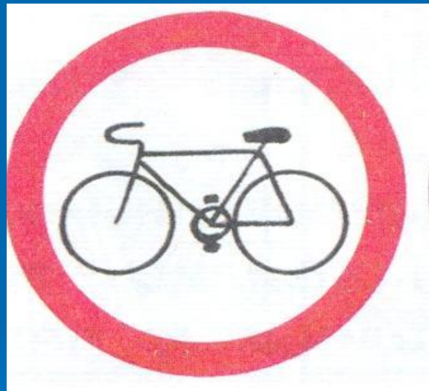
«Движение на велосипедах запрещено»