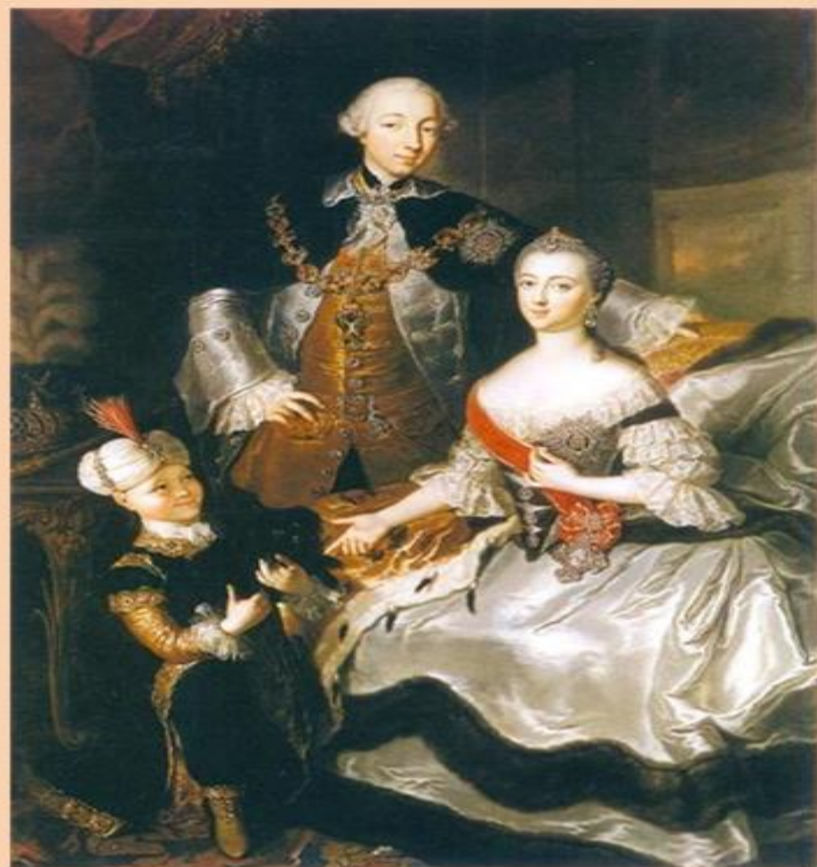
Великая княгиня Екатерина Алексеевна с супругом Петром III Фёдоровичем