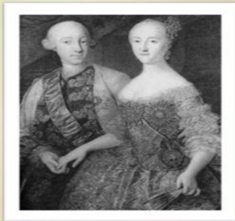
Великий князь Петр Федорович и Великая княгиня Екатерина Алексеевна