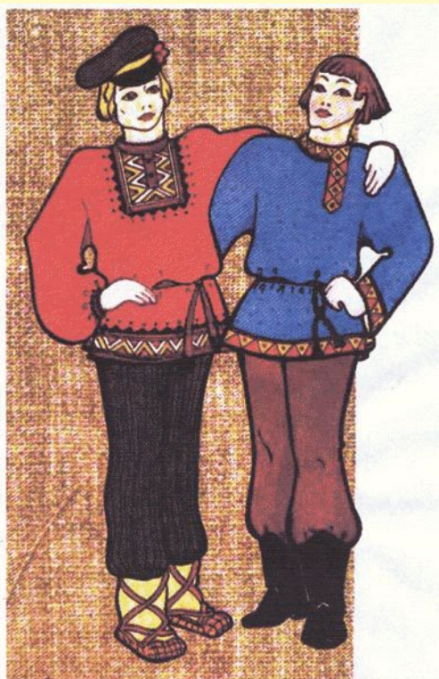
МУЖСКОЙ КРЕСТЬЯНСКИЙ КОСТЮМ (РУБАХА И ПОРТЫ)