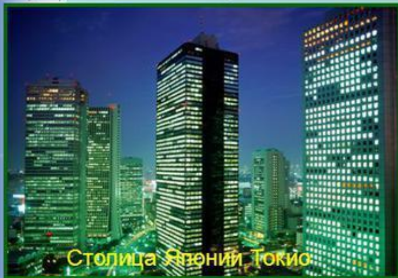
Столица Японии Токио