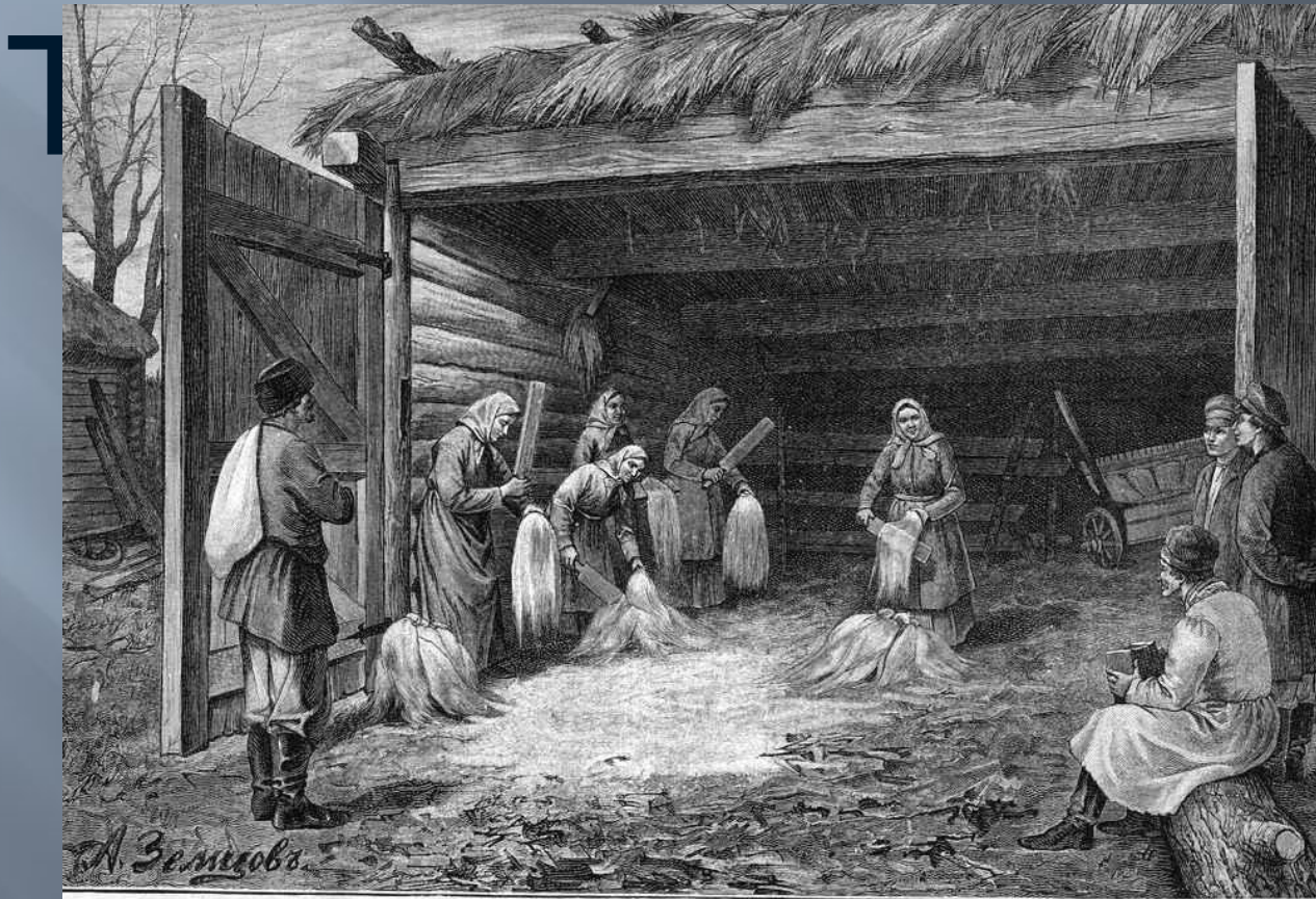
Трепаніє льна. Ориг. рис. (собств. „Нивы“) А. Земцова, грав. Флюгель.