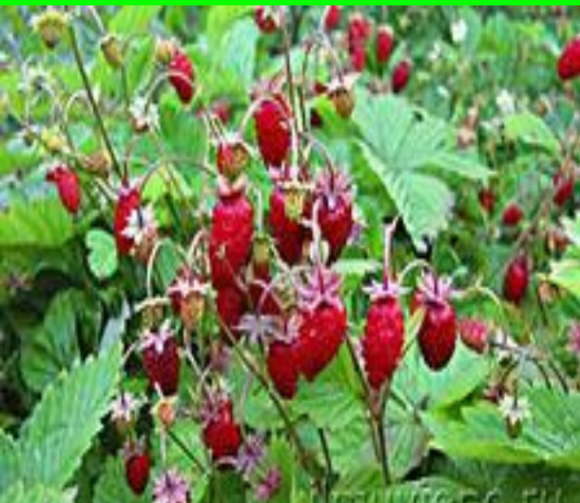
Хурән ҷырли (земляника)