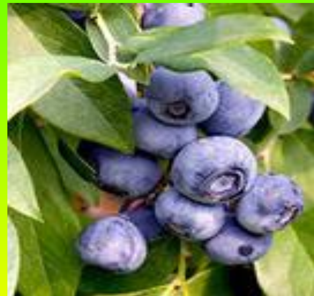
Хура ҷырла (черника)