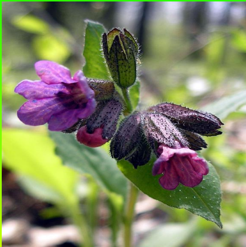
Пыл курăкё- ҕеҕпёл (медуница)