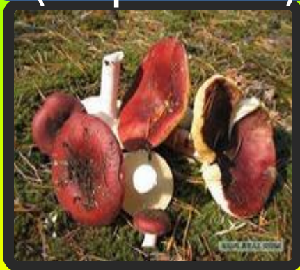
майра кӓмпи (сыроежки)