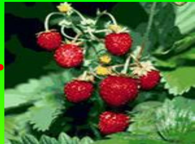
Ҷёр ҷырли (клубника)