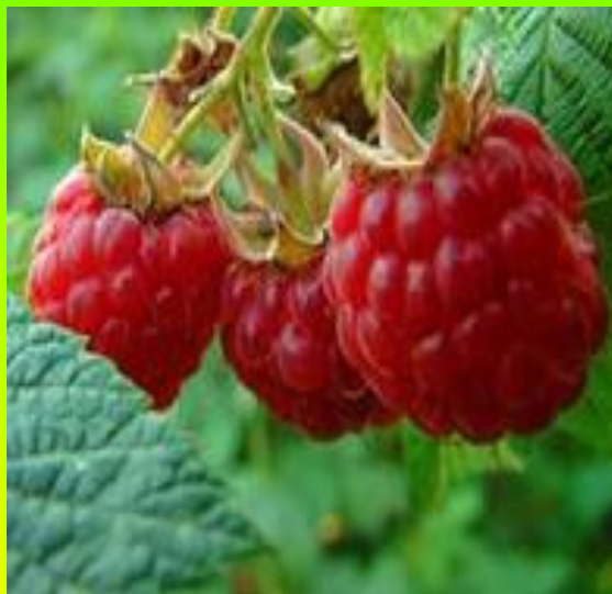
Хәмла ҷырли (малина)