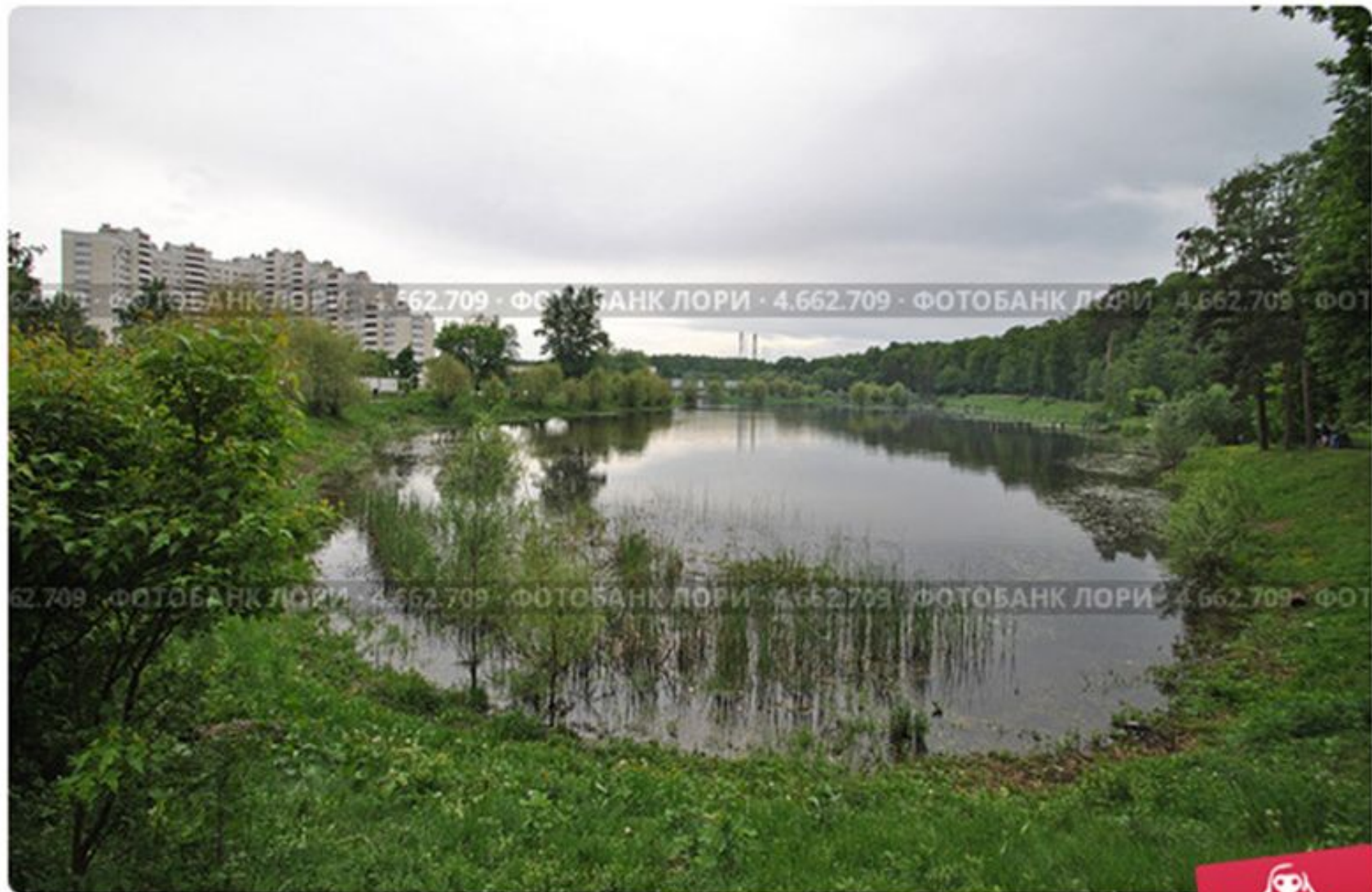
"Бабаевский" пруд весной, парк "Лосиный остров", район Гольяново, М