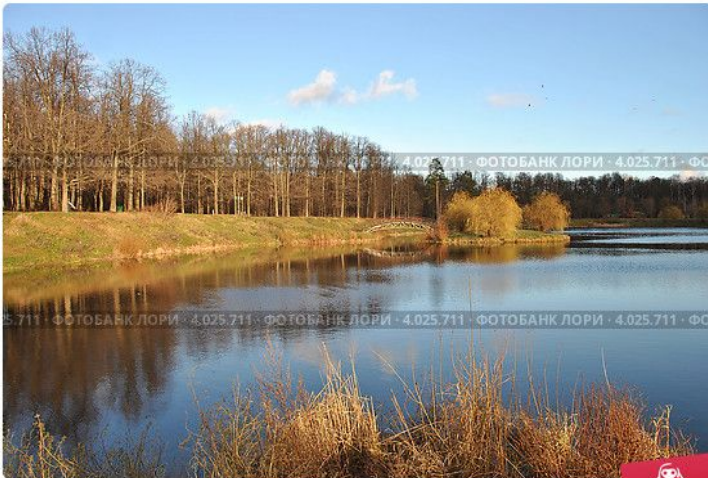
Бабаевский пруд, Национальный парк «Лосиный остров», район Голья