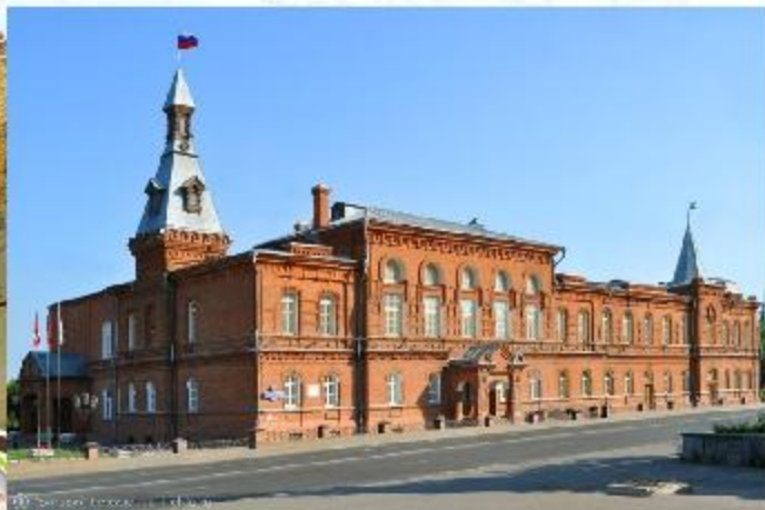
Здание Городской Думы и управы