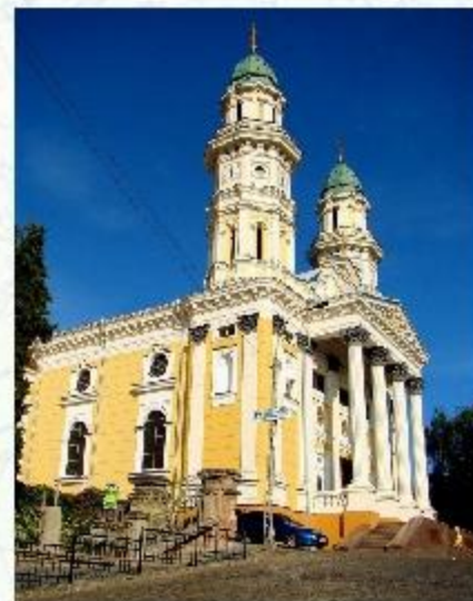
Свято-Никольский Казачий собор