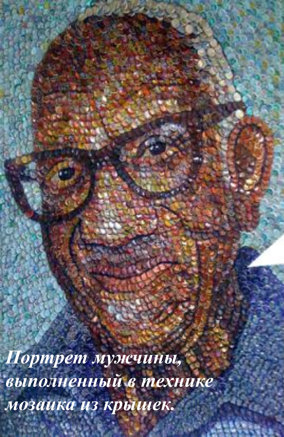
Портрет мужчины, выполненный в технике мозаика из крышек.