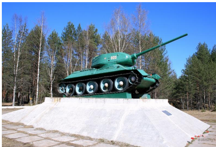
* танк Т-34 *