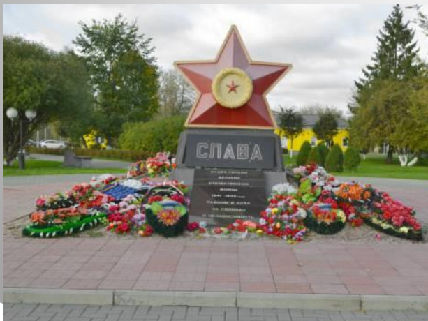
ПАМЯТНИК ВОИНАМ ОСВОБОДИТЕЛЯМ