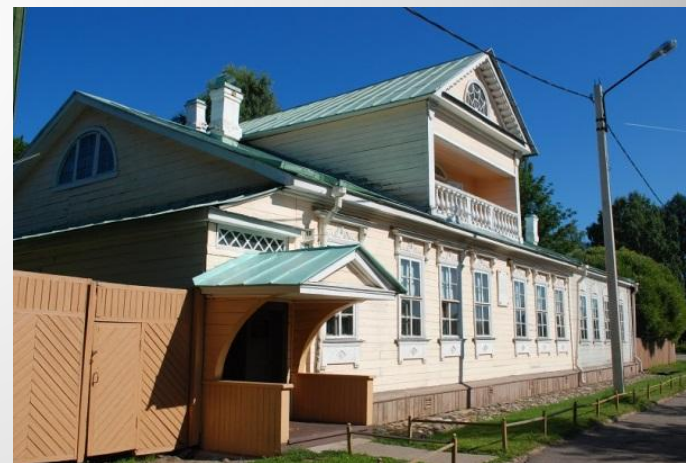
Дом - музей Н.А. Римского-Корсакова

Многие места и старинные усадьбы связаны с именами выдающихся ученых, писателей, художников, композиторов.