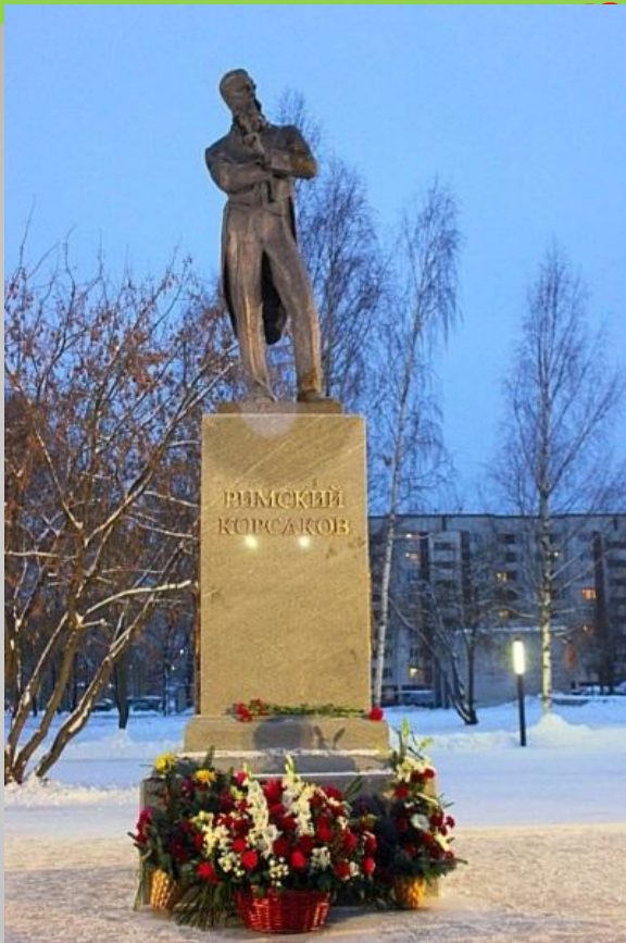
Памятник Н.А. Римского-Корсакова

Многие места и старинные усадьбы связаны с именами выдающихся ученых, писателей, художников, композиторов.