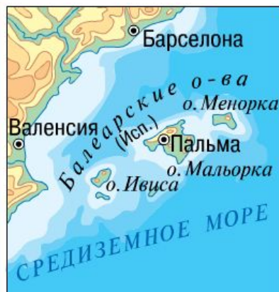
Масштаб 1:15 000 000