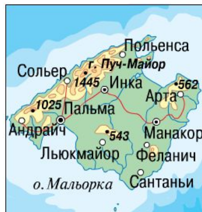
Масштаб 1:3 000 000

- Это величина, показывающая на сколько отрезок (расстояние) на карте меньше, чем на самой местности.