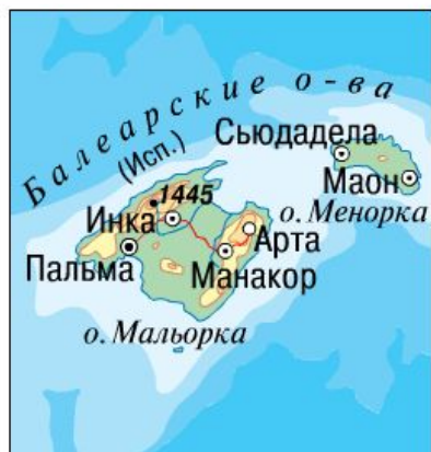
Масштаб 1:6 000 000