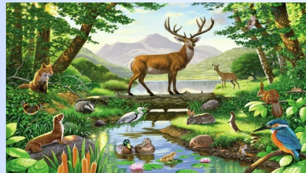
Растительный и животный мир