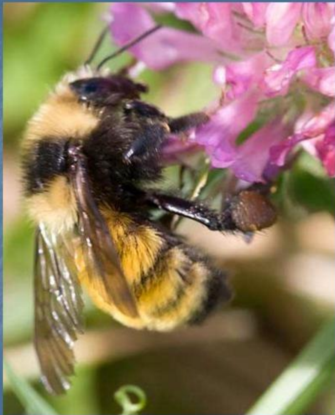
северный золотой шмель