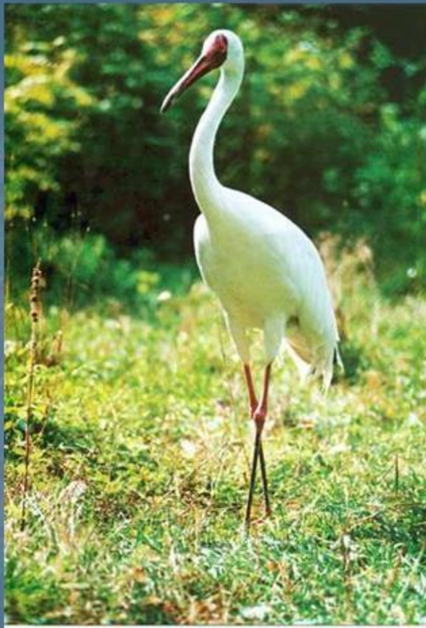
стерх, белый журавль

Здесь обитает и стерх, а по-другому белый журавль.