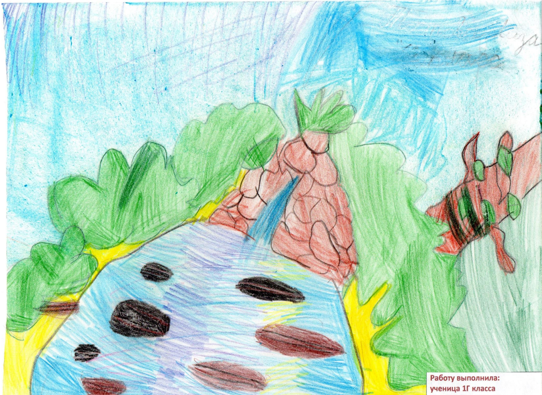
Работу выполнила: ученица 1Г класса