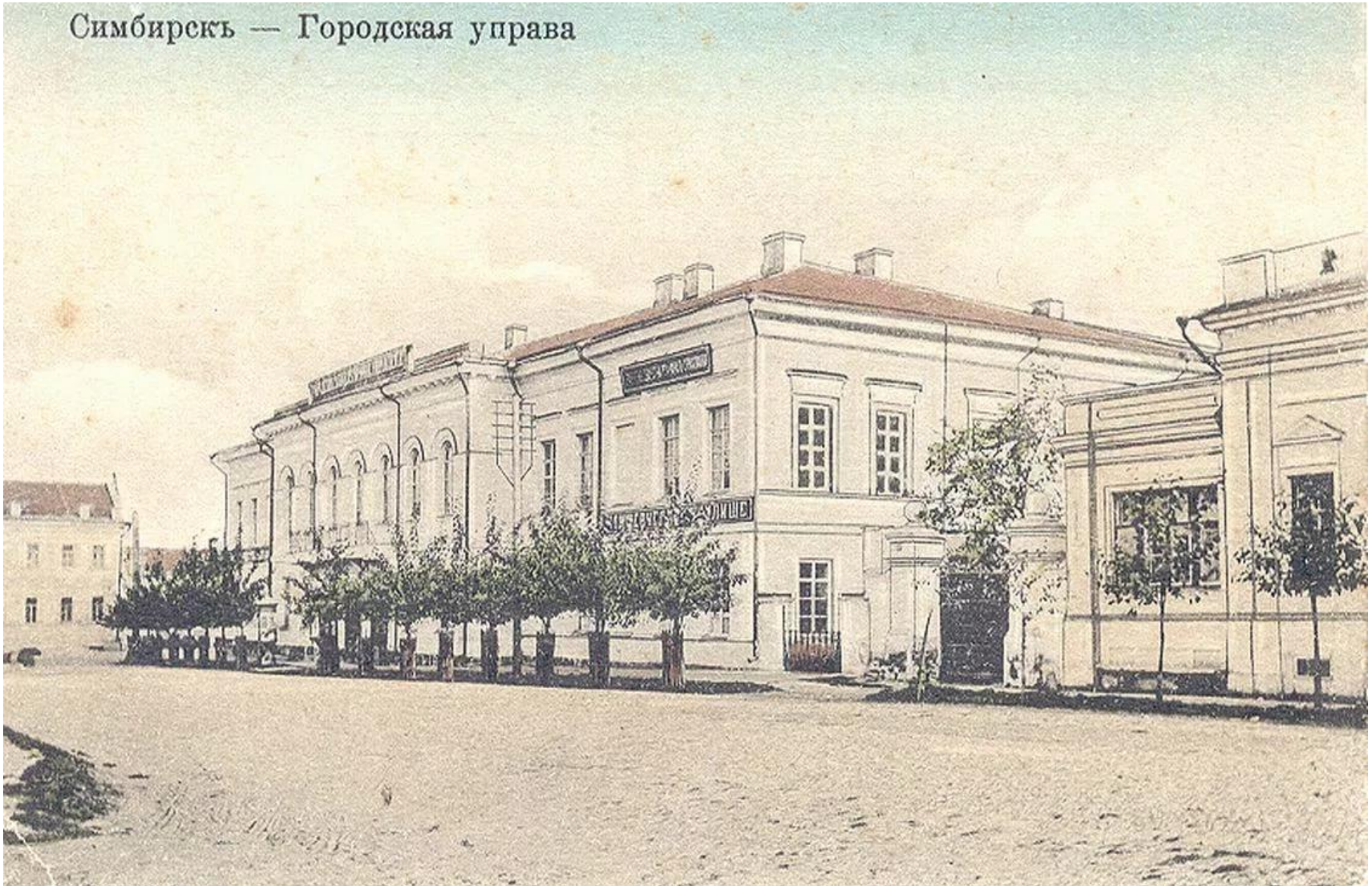
Симбирскъ — Городская управа