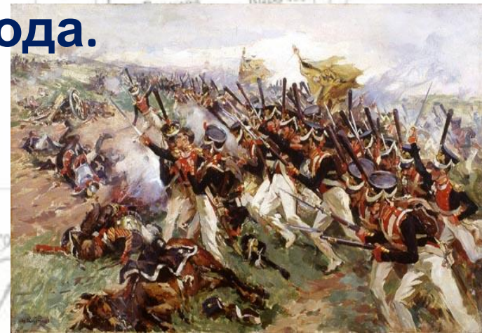
--- Навиская война — Действия русских войск