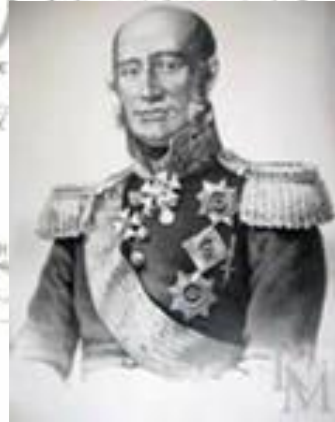
Барклай де Толли Михаил