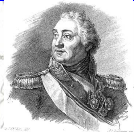
Кутузов Михаил Илларионович