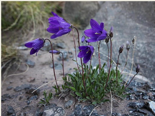
Колокольчик одноцветков ый