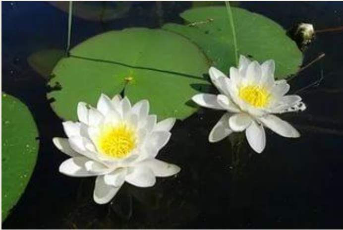
Кувшинка чисто - белая