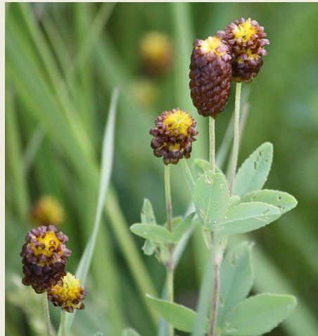
Клевер темно - каштановый