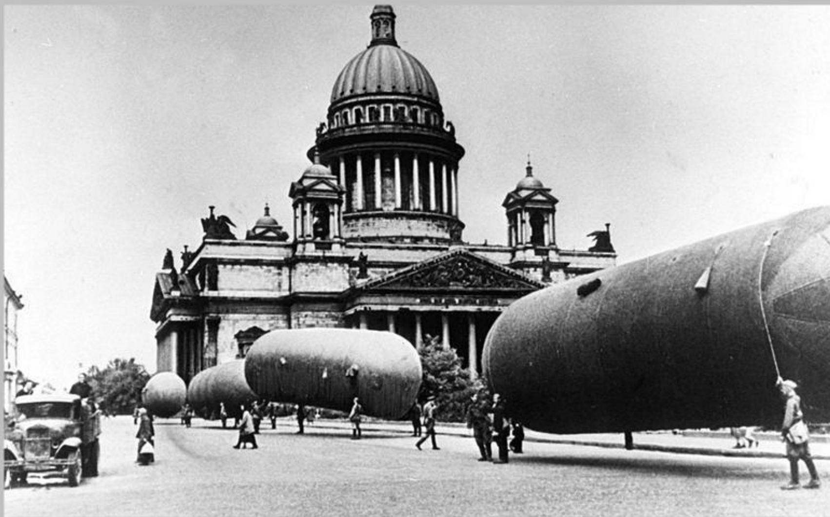
Транспортировка газгольдера, 1943 г.