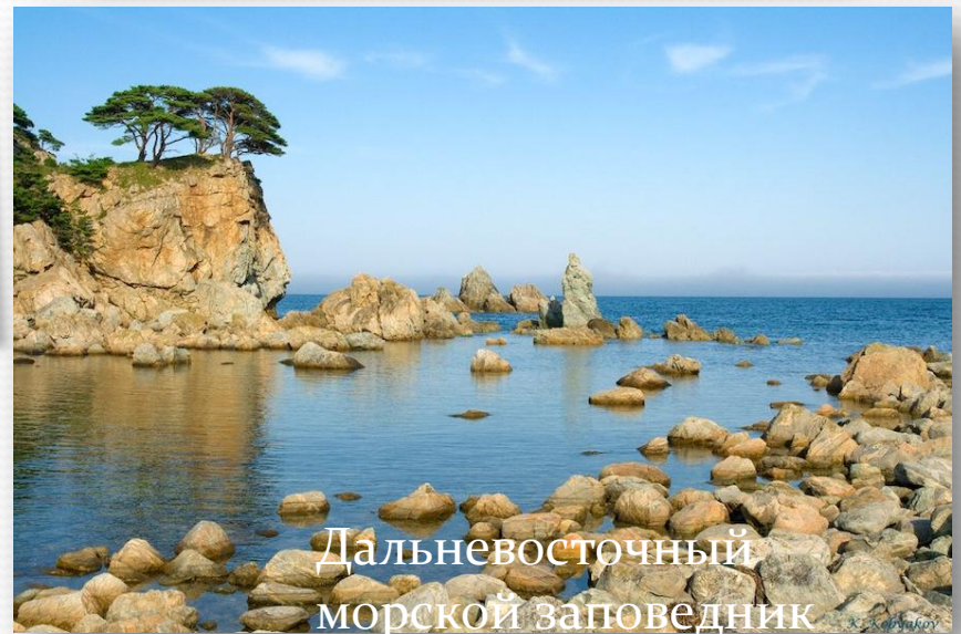
Дальневосточный морской заповедник