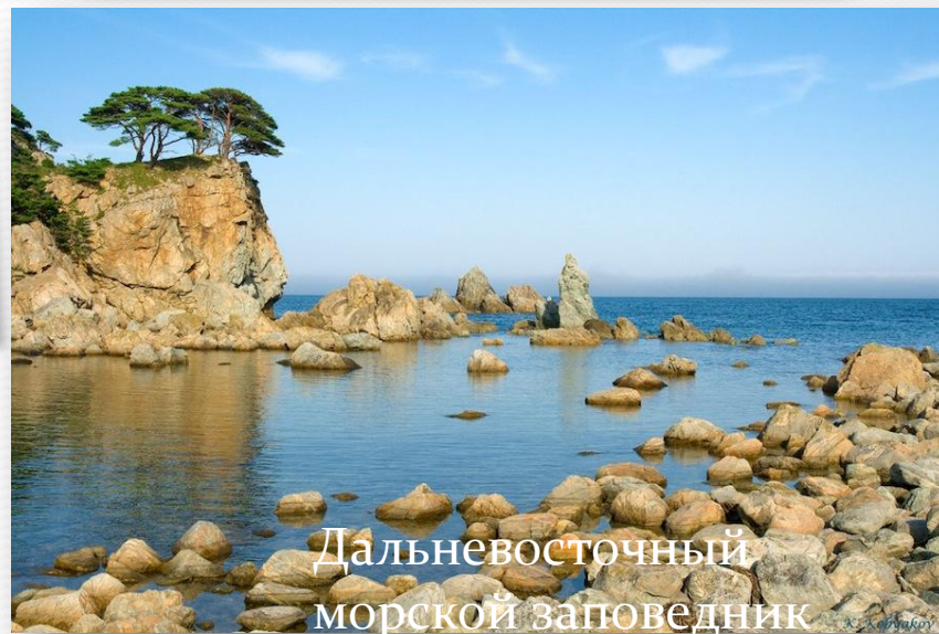
Дальневосточный морской заповедник