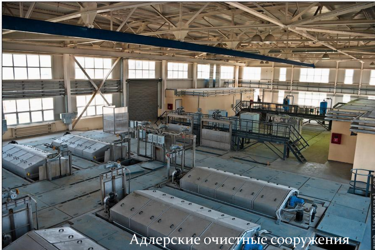
Адлерские очистные сооружения

На производствах внедряются современные очистные сооружения. Разрабатываются новые экологичные технологии производства.