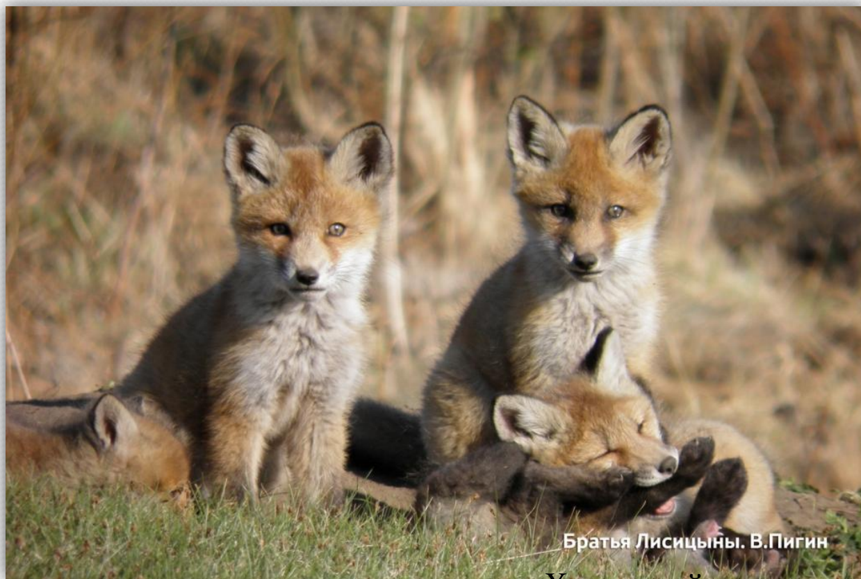
Братья Лисицыны. В.Пигин

Главная задача человека – бережно относиться к природе. Сохранять и приумножать природные богатства. Охранять животные и растения.