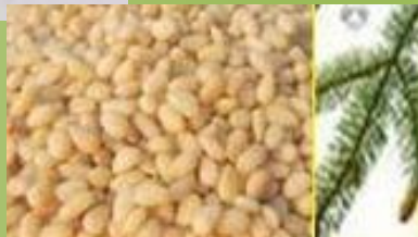
витаминная мука для животных