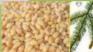
витаминная мука для животных