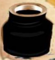
глиняный сосуд, начало X в - «горушна» (пряность)