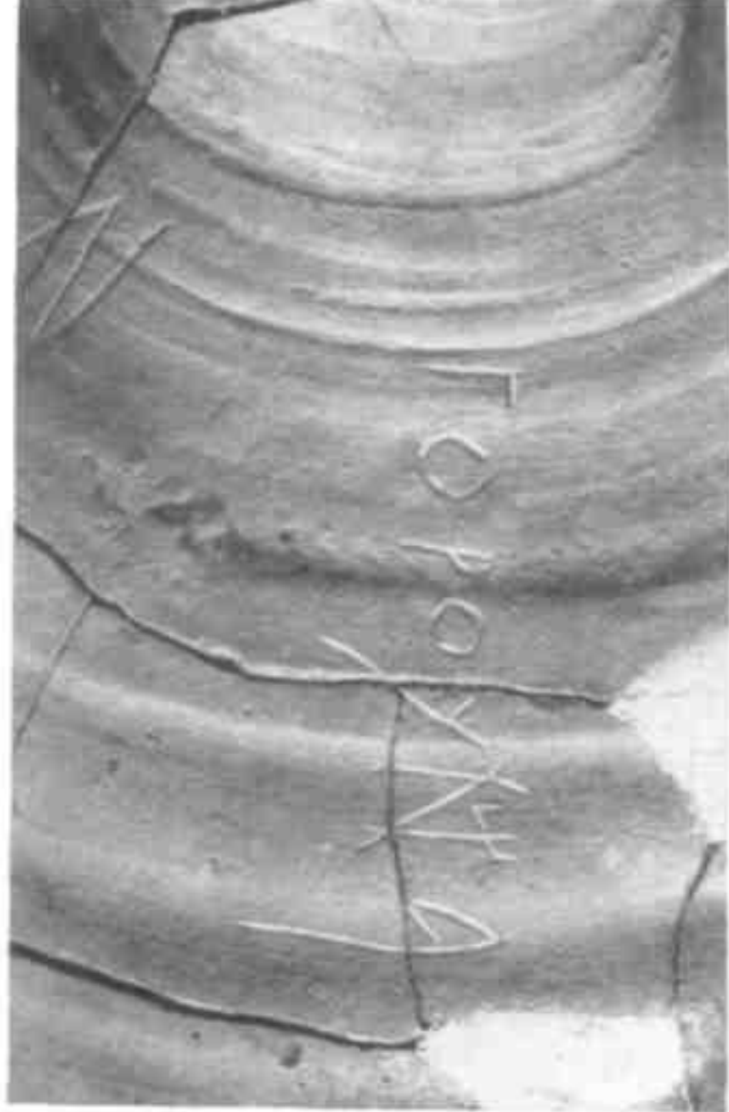
Рис. 4. Надпись на сосуде из кургана № 13