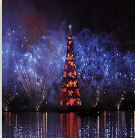
Самая большая елка на воде, Бразилия