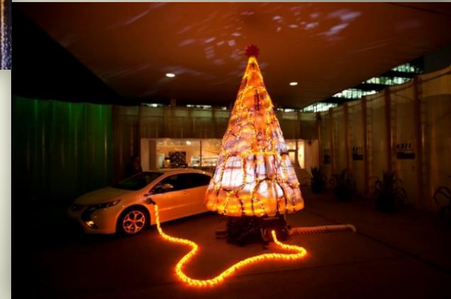
Креативная электрическая елка, Лондон