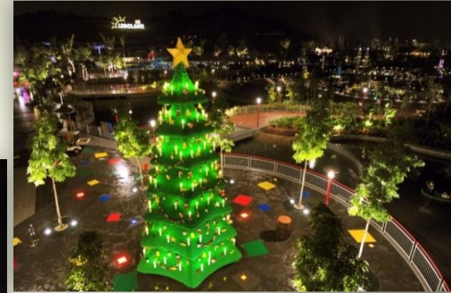
Самая большая елка из LEGO, Малайзия