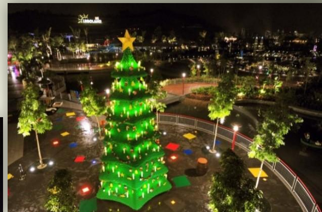
Самая большая елка из LEGO, Малайзия