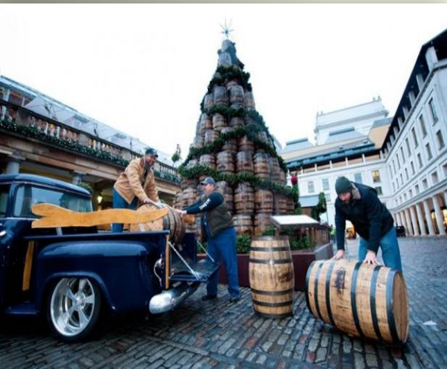
Новогодняя уличная елка из бочек, Лондон