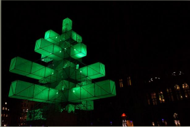
Необычная новогодняя елка в Брюсселе