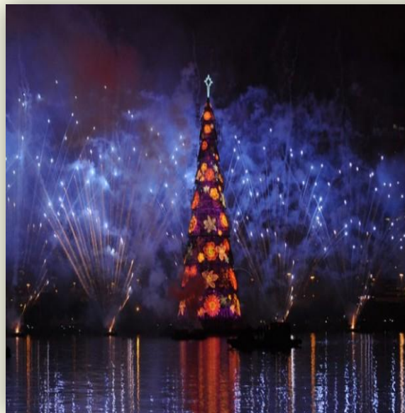
Самая большая елка на воде, Бразилия