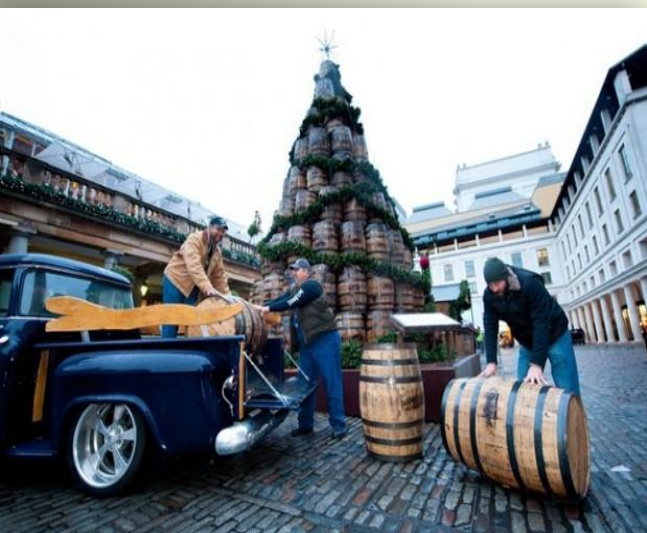
Новогодняя уличная елка из бочек, Лондон