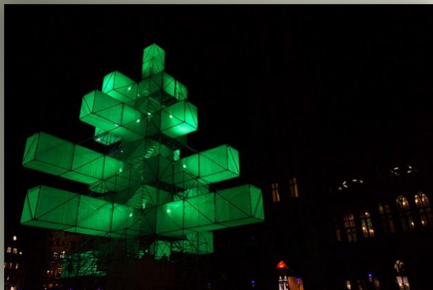
Необычная новогодняя елка в Брюсселе