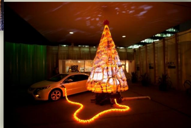
Креативная электрическая елка, Лондон