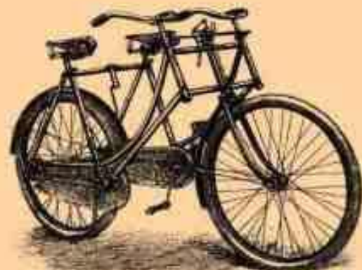
6. Двухместный (обыкновенный) В.