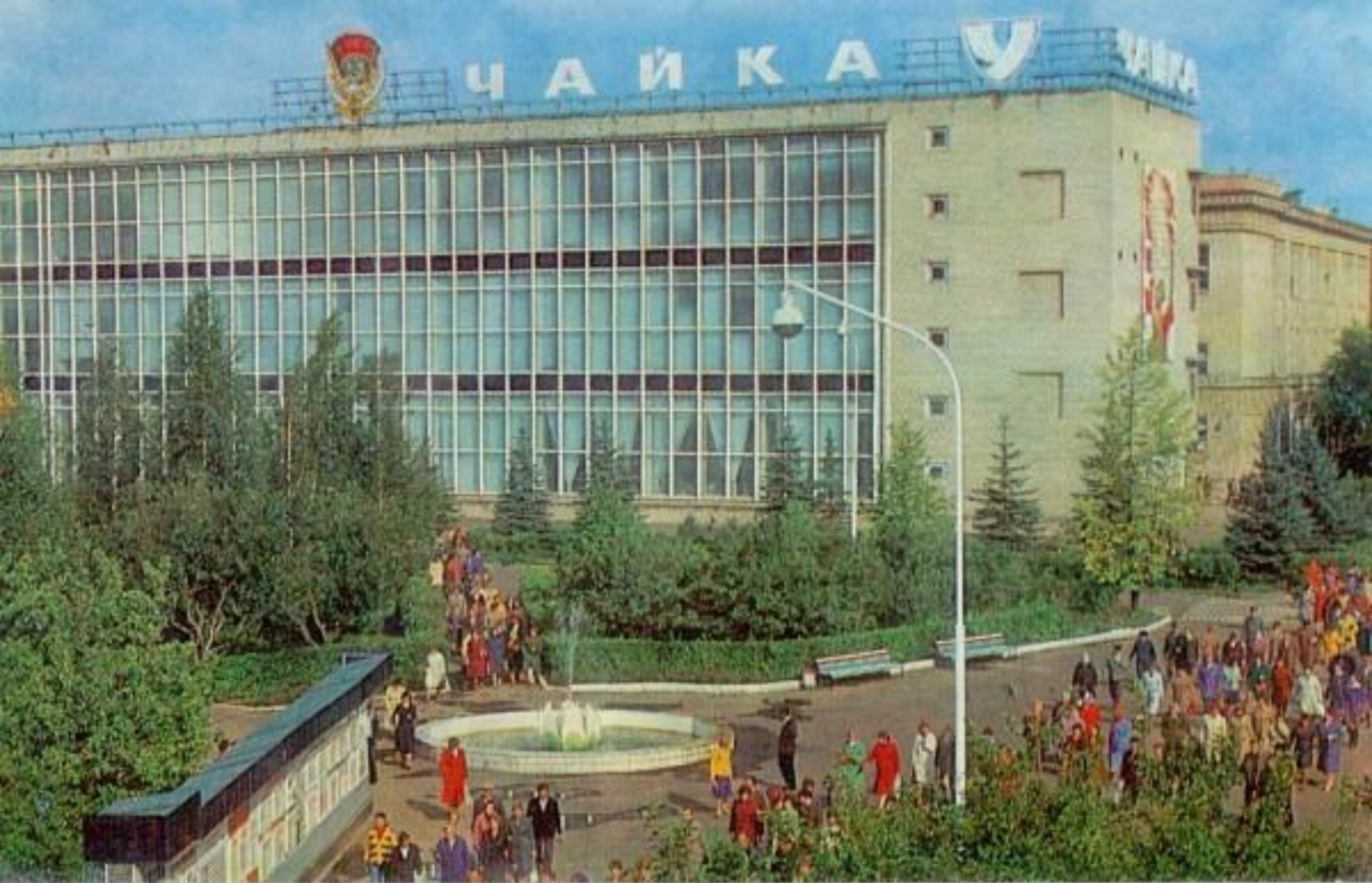
Часовой завод «Чайка»