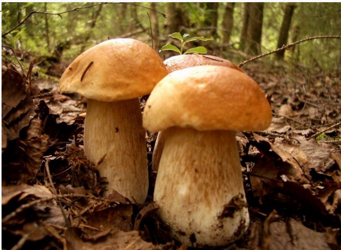
Боровик или Белый гриб