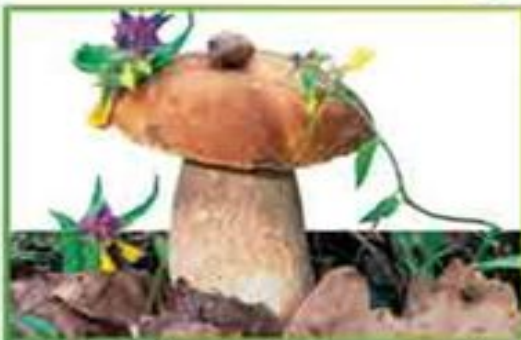
белый гриб (еловый)