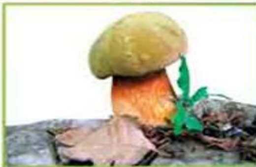
белый гриб (дубовый)