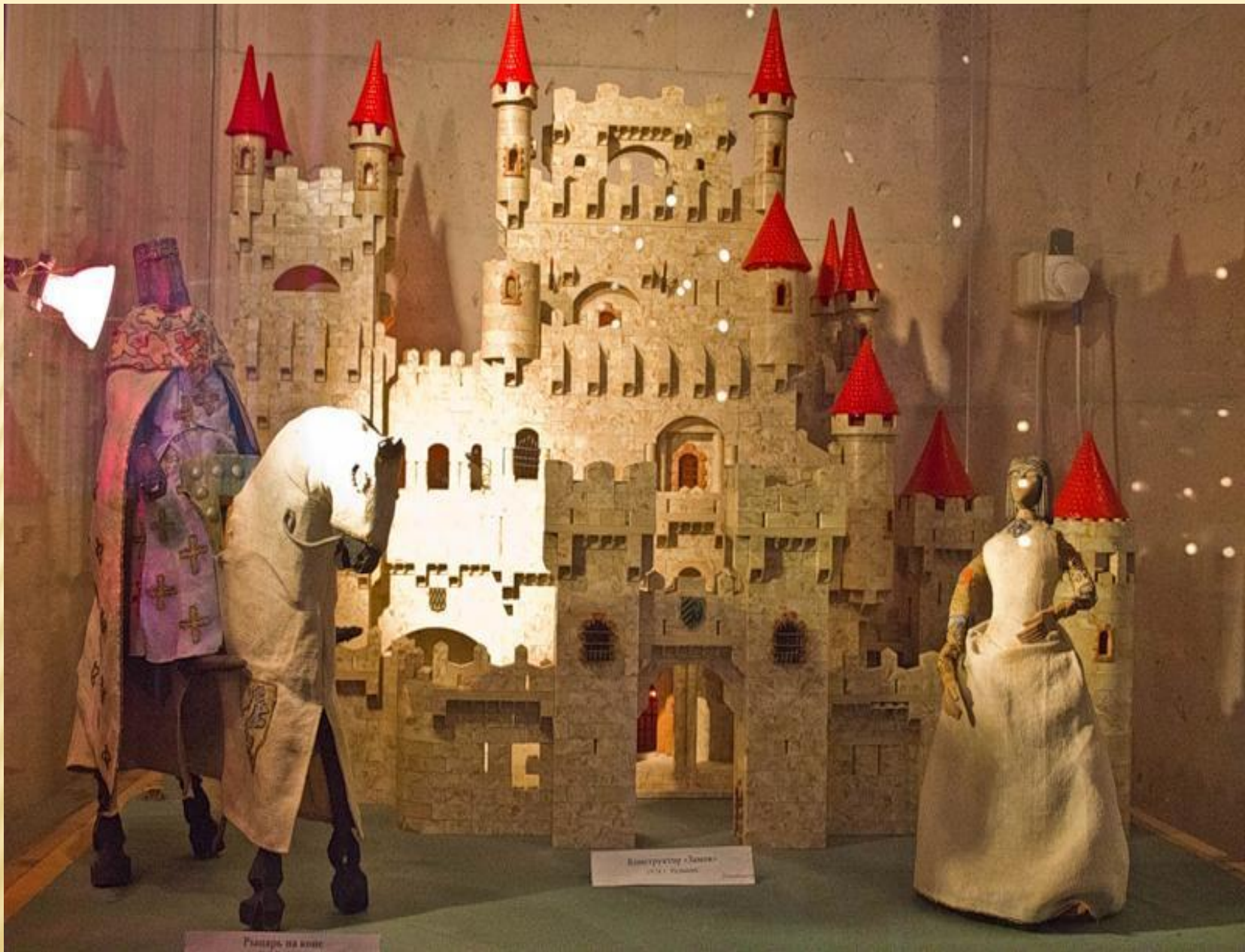
Рыцарь на коне