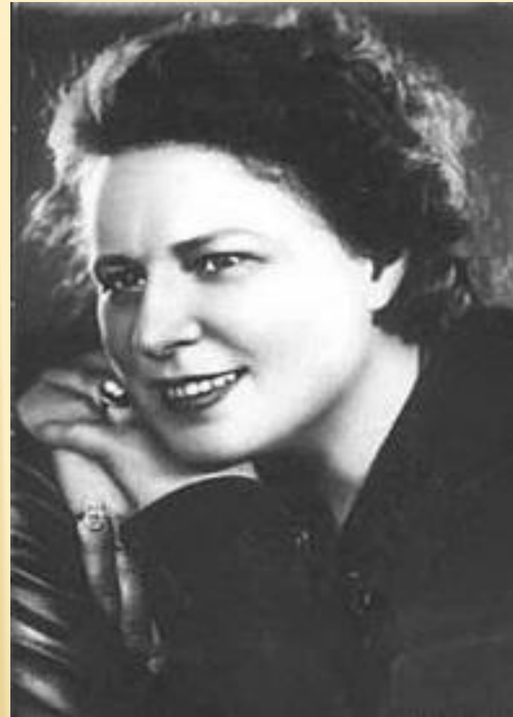
Алла Тарасова, актриса театра и кино