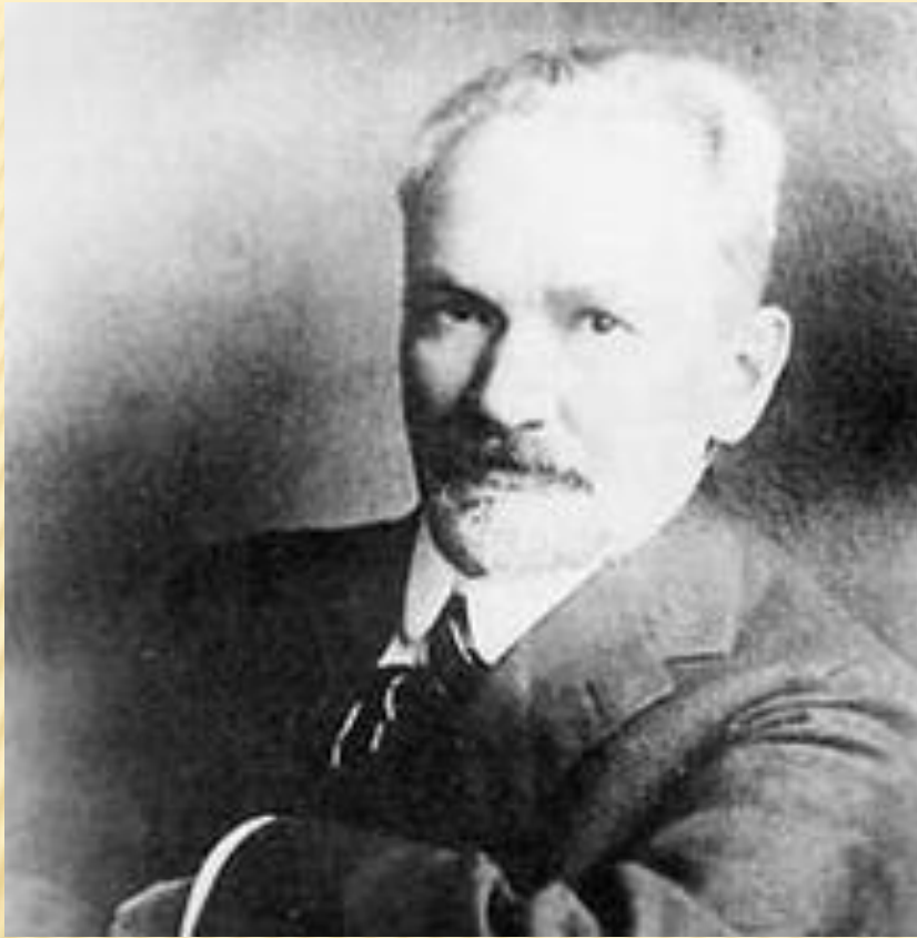
Василий Васильевич Розанов, философ и литературный критик