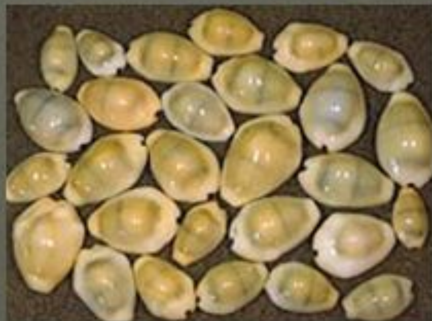
1000 раковин каури