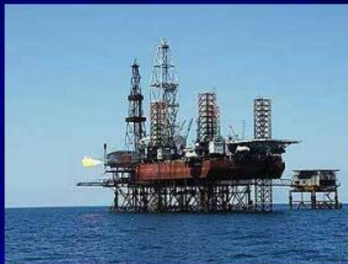
Добыча нефти в море