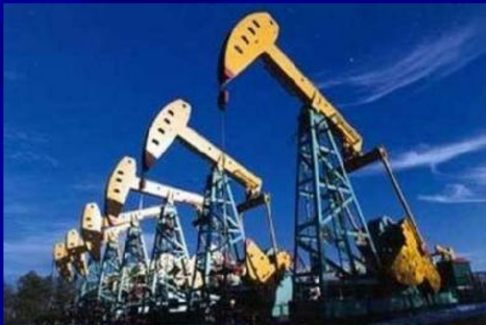
Добыча нефти на суше