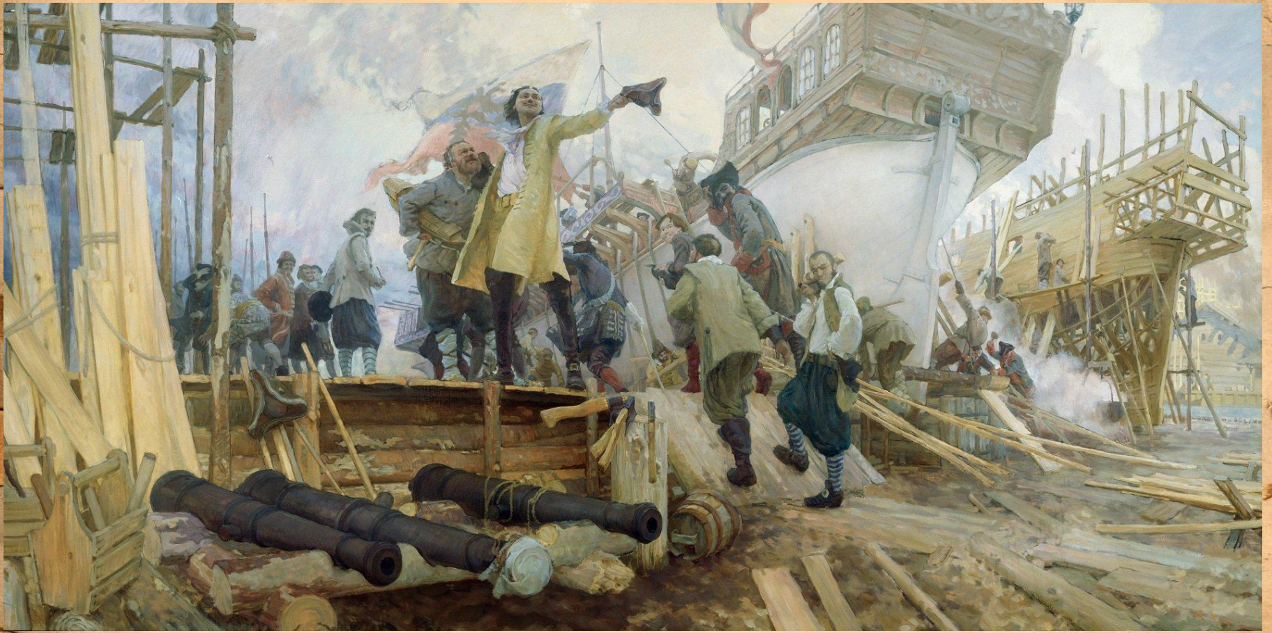
«Новое в России дело» Худ. Ю. Кушевский