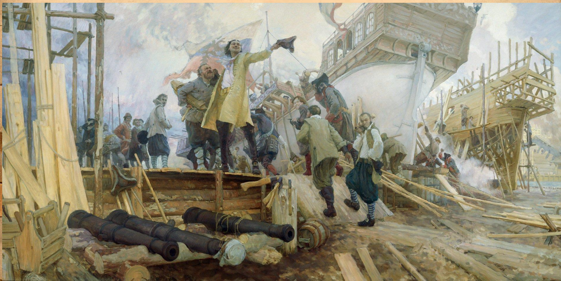
«Новое в России дело» Худ. Ю. Кушевский