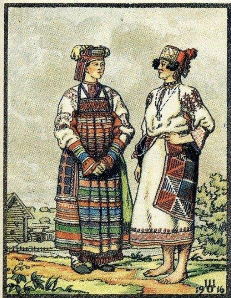
Народная женская одежда. ВЕЛИКОРОССЫ Курской и Орловской губерний.