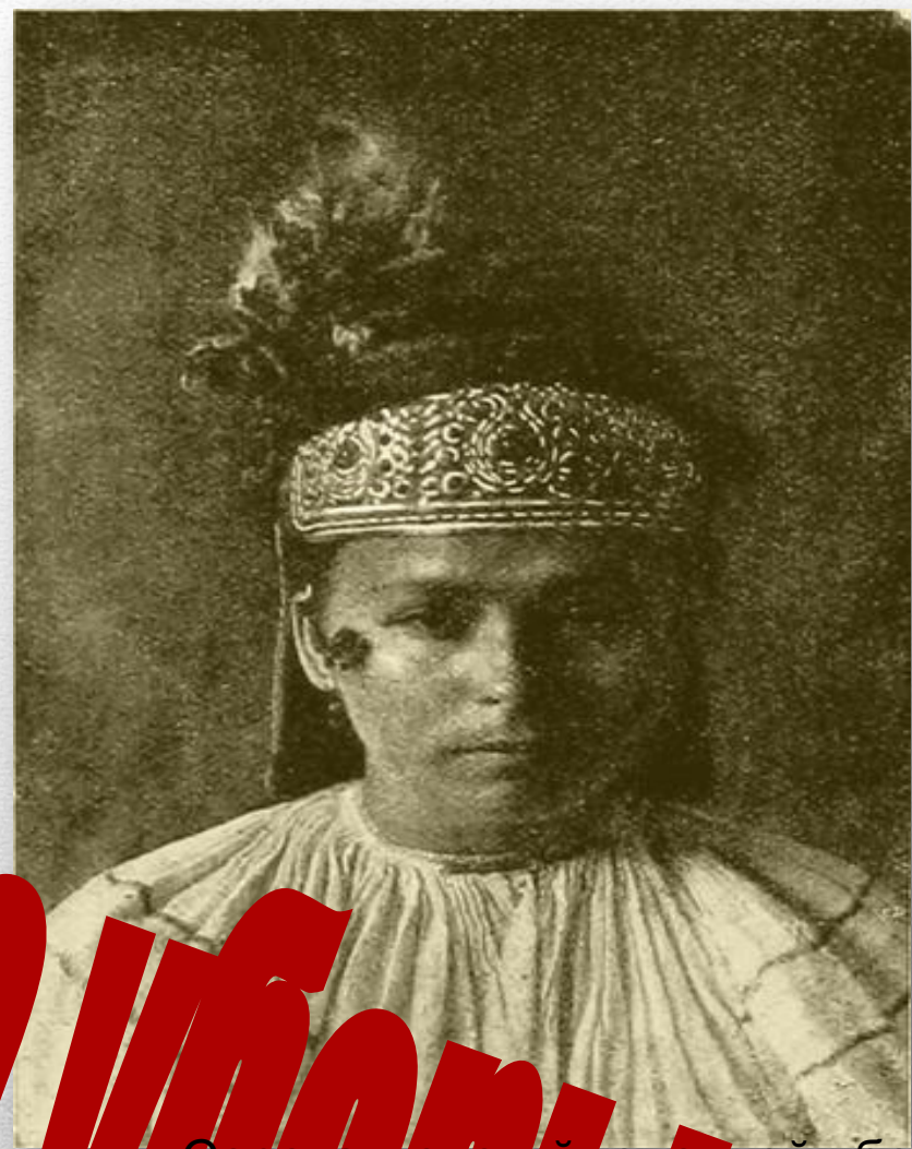
Сорока-женский головной убор. Курская Губерния XIX в.

Везде различали девичьи и женские головные уборы.