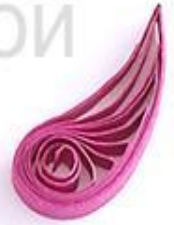
изогнутая капля (крыло, лепесток)