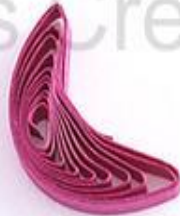
изогнутый полукруг (месяц, полумесяц)