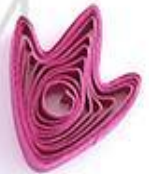
утиная лапка (птичья лапка)