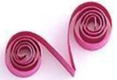
завиток в форме V