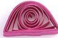
полукруг (конфетка, круглый леденец, половинка луны)