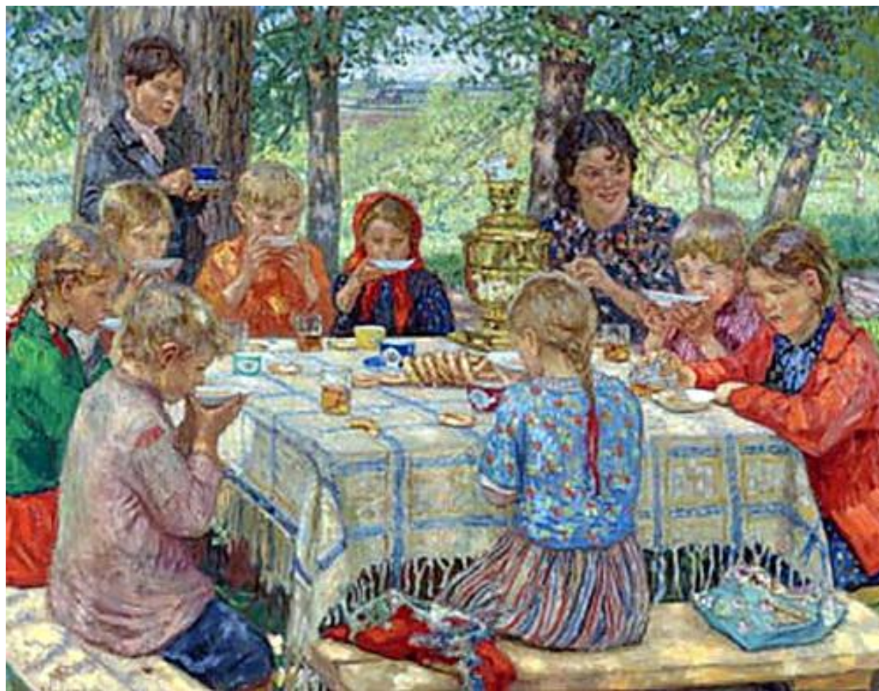
Н.П.Богданов-Бельский День рождения учительницы