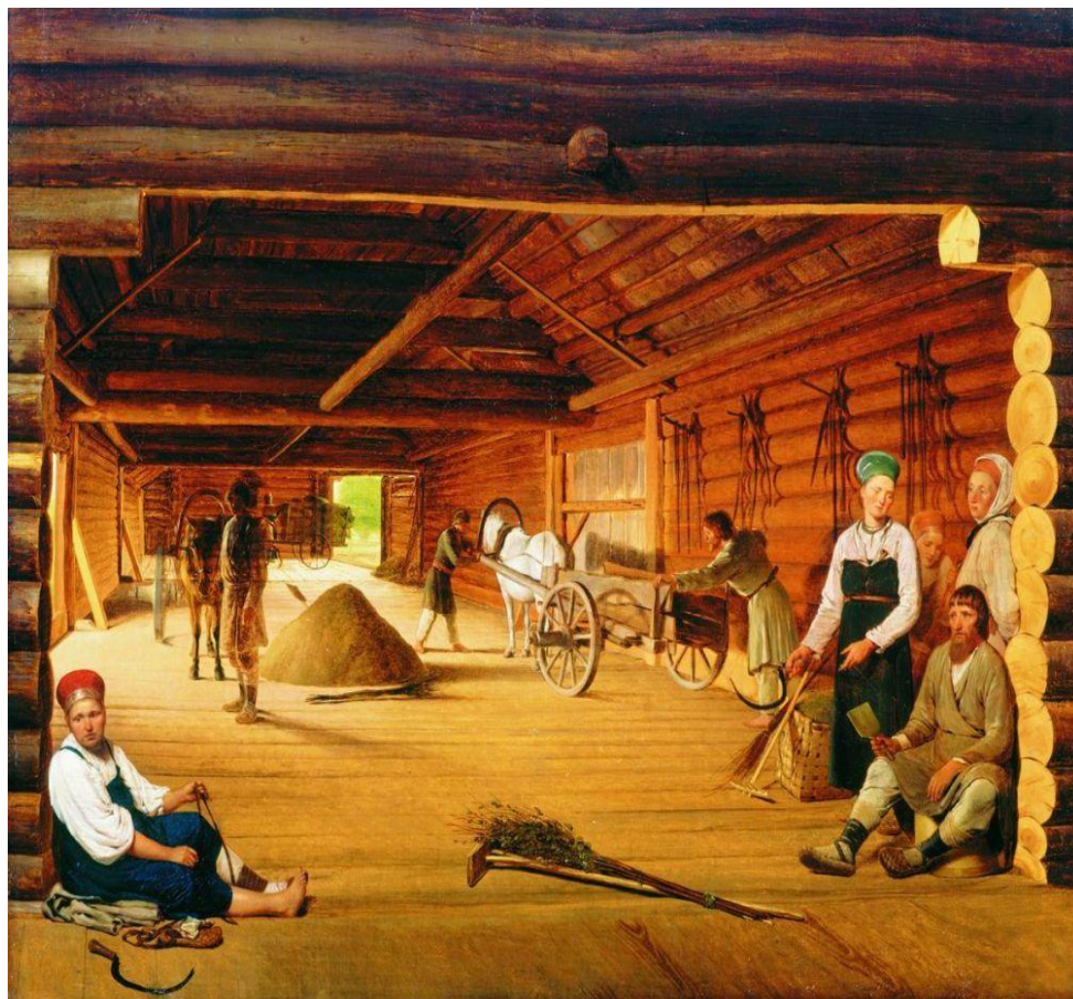
Карл Павлович Брюлова «Портрет княгини С. П. Салтыковой» и Алексей Гаврилович Венецианов «Гумно».