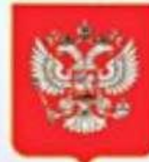
Государственный герб России