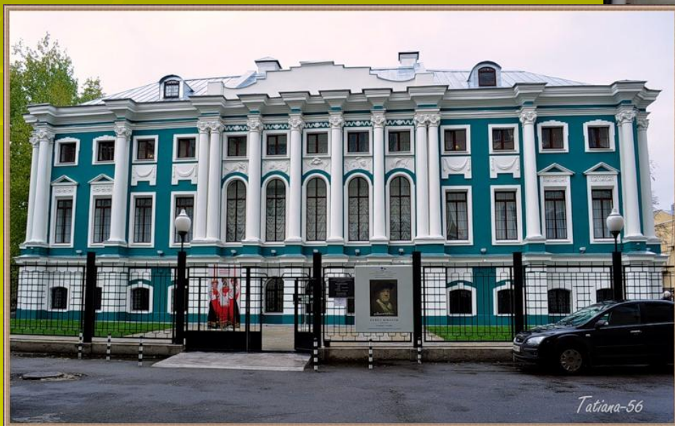
Музей имени И.М. Крамского