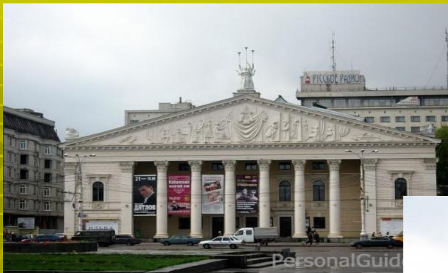
Театр оперы и балета