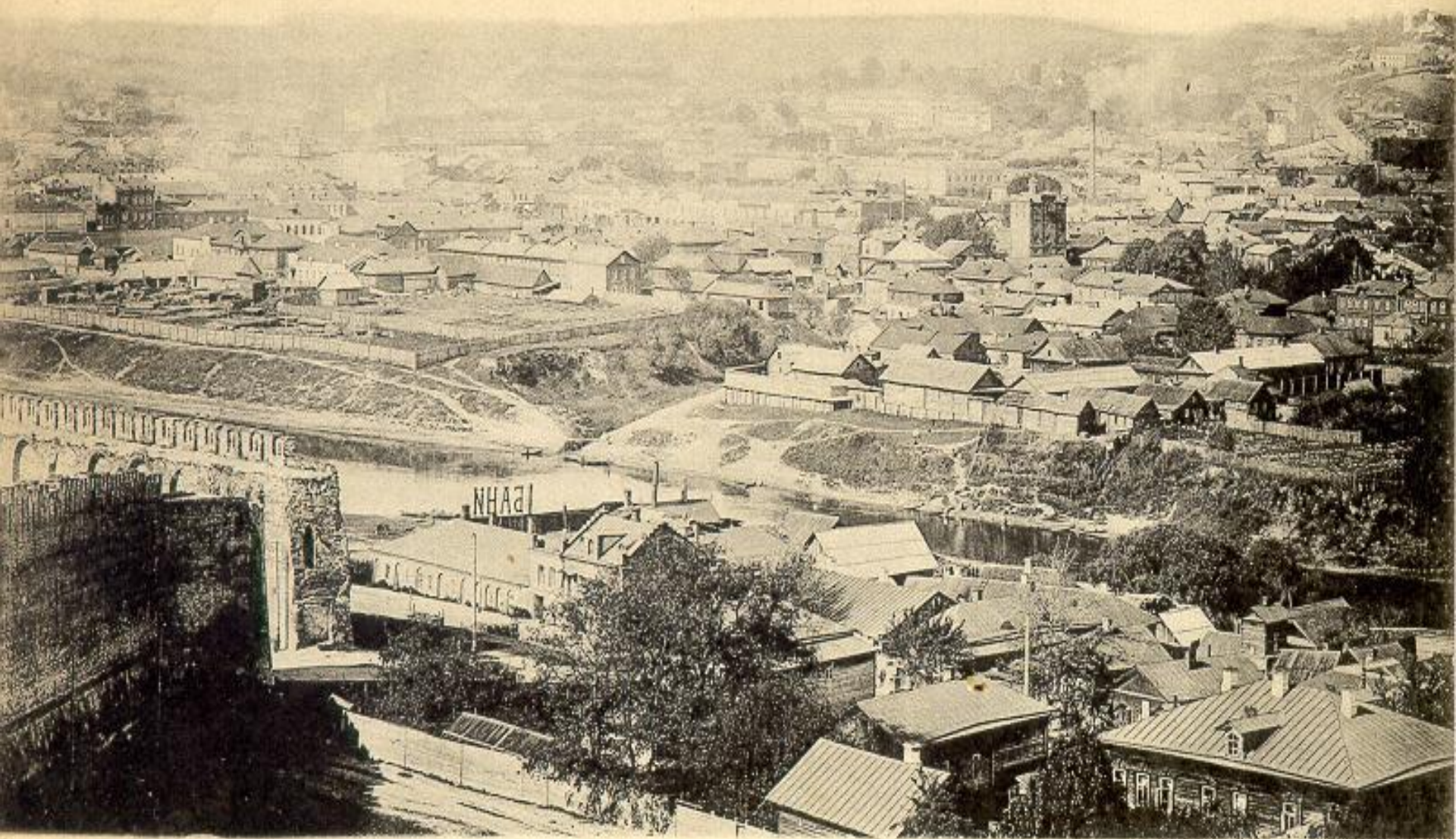
Смоленскъ. Видъ на Заднѣпровье