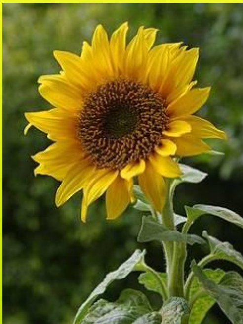
п о д с о л н е ч н и к